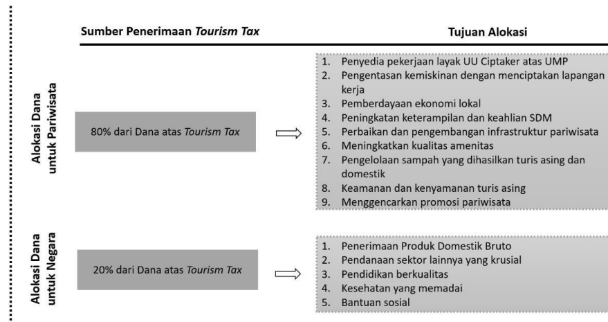
Gambar 3. Desain Earmarking Tourism Tax