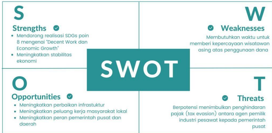
Gambar 4. Analisis SWOT atas Kebijakan Tourism Tax di Indonesia

Skema rancangan kebijakan tourism tax dapat menimbulkan berbagai reaksi yang muncul dari para turis asing. Sebab, penerapan kebijakan tourism tax akan menambah beban pajak bagi wisatawan asing ketika berkunjung ke Indonesia. Oleh karena itu, perlu peninjauan lebih lanjut mengenai kebijakan tourism tax menggunakan analisis SWOT ( Strengths, Weakness, Opportunities and Threats ):