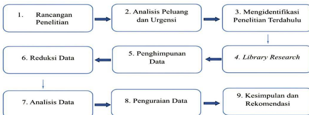
Gambar 1. Alur Metode Penelitian

Penelitian ini menggunakan pendekatan kualitatif deskriptif dengan teknik pengumpulan data dan informasi melalui library research untuk mengolah, mengkaji, dan menganalisis data yang diperoleh secara terperinci serta sistematis dari berbagai penemuan mengenai pariwisata dan kebijakan pajak atas turis asing (Sholikhah, 2016). Penelitian ini menggunakan sumber data sekunder dengan temuan dari jurnal nasional maupun internasional melalui publish & perish , research gate , sciencedirect , connected papers , open knowledge maps , pubmed dan google scholar yang terakreditasi SINTA maupun Scopus, artikel ilmiah, website yang tervalidasi, buku yang relevan, teori-teori yang diuji kebenarannya, dan laporan kredibel. Teknik analisis data dilakukan secara induktif agar penjelasan dan pemahaman data yang dikumpulkan dapat dianalisis secara mendalam (Sugiono, 2021). Penelitian ini menggunakan analisis skenario melalui benchmark , komparasi jenis pungutan pajak yang berpotensi untuk sektor pariwisata, skema kebijakan pajak melalui tourism tax , simulasi proyeksi atas perhitungan potensi tourism tax , desain earmarking tourism tax , serta analisis SWOT untuk penerapan tourism tax .