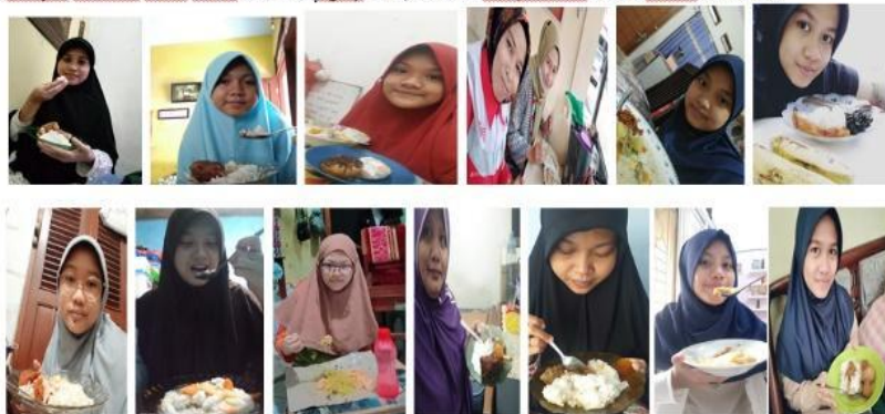
Gambar 4. Sarapan Bersama siswa MTsN 6 Jakarta digrup PMR, Pembina UKS, Pembina PMR & Pelatih PMR/UKS