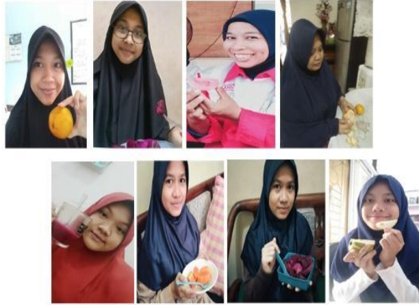
Gambar 5. Siswi-siswi mengkonsumsi buah-buahan