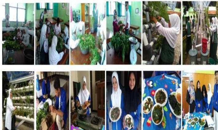
Gambar 7. Proses pengolahan hasil panen hidroponik