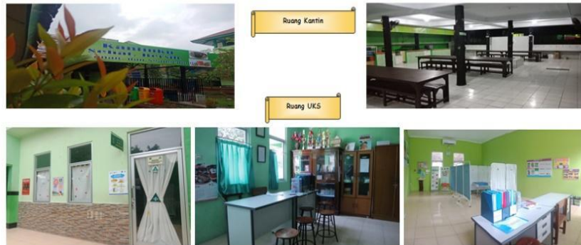
Gambar 9. Sarana dan Prasarana Pendukung Program Nutrition Goes To School di MTsN 6 Jakarta