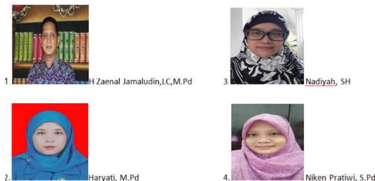
Gambar 11. Guru yang mendapatkan Pelatihan dari SEAMEO RECFON) Program Gizi Untuk Prestasi ( Nutrition Goes to School/NGTS ) MTsN 6 Jakarta secara daring.