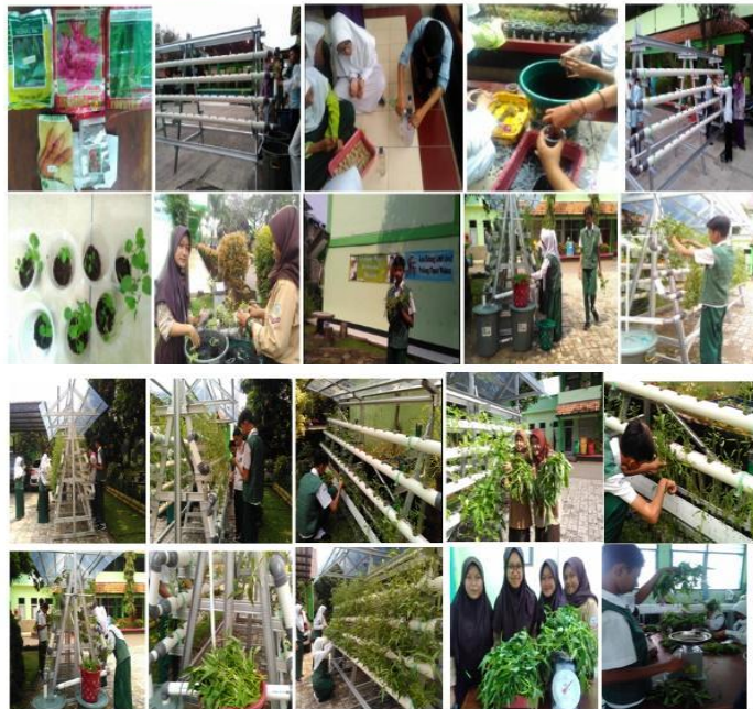
Gambar 6. Dokumentasi Program Hidroponik sebelum pandemi Covid-19