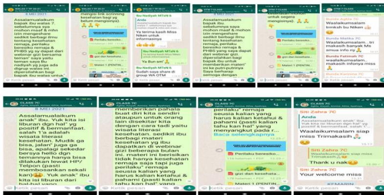
Gambar 3. Pemberitahuan program Nutrition Goes to School di MTsN 6 Jakarta pada masa pandemi Covid-19