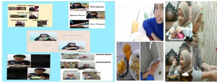
Gambar 8. Sarapan Sahur sehat, berbuka puasa dan gerakan PHBS bersama siswi-siswi