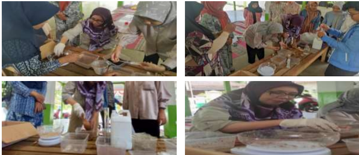
Gambar 2. Pelatihan Pengolahan Limbah Cair Batik Sujo dengan Teknik Mikoremediasi

Pelatihan pengolahan limbah cair batik zero-waste berbasis mikoremediasi dilakukan setelah edukasi dan sesi tanya jawab. Para Pengrajin batik diberikan pelatihan pengolahan limbah batik. Pelatihan dilakukan secara real di lapangan. Pelatihan dilakukan secara sederhana. Tim pengabdian membawa kultur kapang pelapuk kayu dan media tanam, sedangkan Pengrajin batik menyediakan serbuk gergajian. Dokumentasi pelatihan disajikan pada Gambar 2.