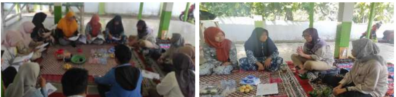
Gambar 1. Dokumentasi Edukasi Tim Pengabdian dengan Pengrajin Batik Sujo

Edukasi dilakukan dengan metode ceramah dan diskusi. Ceramah dan diskusi membantu Para Pengrajin batik Sujo memahami urgensi limbah cair batik dan pemanfaatan kapang pelapuk kayu sebagai agen pengolahan limbah cair batik. Pemahaman Para