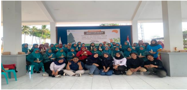
Gambar 5. Foto bersama usai kegiatan dengan membawa produk PKM