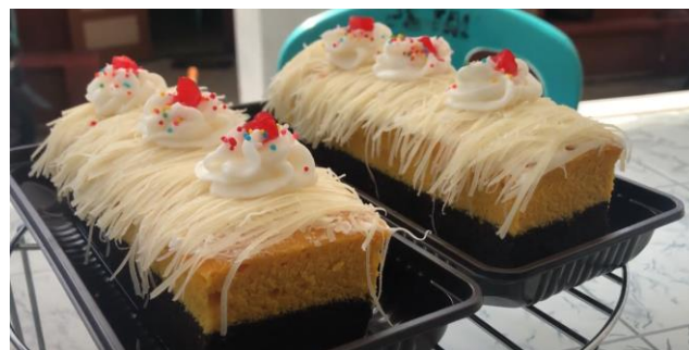
Gambar 4. Produk lapis kukus jagung

Peserta pelatihan yang datang sebanyak 30 orang, selama pelatihan mereka menunjukkan respon yang antusias dan aktif. Peserta tidak hanya menonton tetapi juga mencoba membuat produk dengan didampingi oleh Tim Satgas PKM yang terdiri dari mahasiswa dan alumni. Berikut pada Gambar 4 dapat dilihat produk yang dibuat saat PKM.