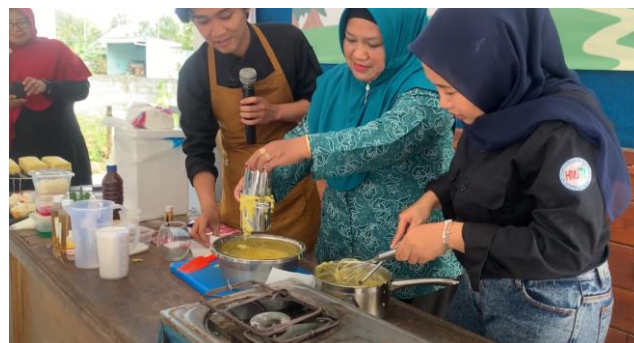
Gambar 3. Kegiatan pelatihan pembuatan produk jagung.

Adapun solusi yang dapat diberikan oleh Tim Satgas PKM UM adalah memberikan Edukasi tentang jenis-jenis olahan jagung, agar dapat meningkatkan perekonomian Masyarakat Talok. Setelah itu tim satgas PKM UM memberikan pelatihan tentang Membuat kue lapis jagung dan cendol jagung, peserta pelatihan merupakan Ibu-Ibu PKK. Pertimbangan dalam memilih produk kuliner tersebut karena pemrosesan yang sederhana dan tidak membutuhkan peralatan sulit dapat mendorong peserta untuk merealisasikan pengetahuan dan keterampilan yang didapatkan saat pelatihan. Diharapkan setelah mengikuti pelatihan peserta dapat membuat aneka olahan pangan berbahan dasar jagung dengan baik sehingga berdaya jual. Berikut dapat dilihat pada Gambar 3 yaitu dokumentasi kegiatan pemaparan materi pelatihan dan peserta.