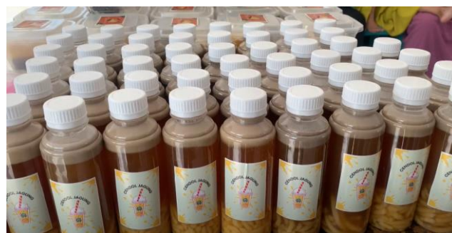
Gambar 5. Produk cendol jagung

Setelah melakukan evaluasi pelaksanaan, peserta melakukan foto bersama dengan membawa produk PKM