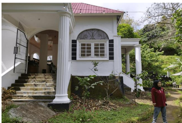
Gambar 2. Area belakang cafe yang menghadap arah cafe

Telah dilakukan survei lokasi pada 15 Juli 2023 didapatkan hasil bahwa lokasi cafe adalah lokasi yang paling strategis dan banyak dikunjungi oleh wisatawan karena terletak di area depan. Pada bagian belakang cafe terdapat lahan kosong cukup luas yang hanya terdapat beberapa tanaman saja. Berdasarkan hasil survei, area yang ditunjukkan pada Gambar 2 kurang cocok karena background yang terkesan monoton dan tidak ada unsur alam.