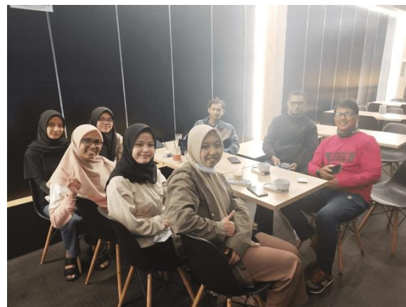
Gambar 4. Diskusi dengan mitra

Kegiatan selanjutnya setelah survei adalah diskusi dengan mitra yang ditunjukkan pada Gambar 4. Diskusi dilakukan pada 2 Agustus 2023 untuk membahas desain spot foto dan jenis tanaman hias yang digunakan. Lalu dilanjutkan dengan membahas alat dan bahan yang diperlukan untuk membangun spot foto beserta anggaran yang diperlukan. Alat dan bahan yang dibutuhkan adalah besi, cat, tanaman hias, dan lain-lain.