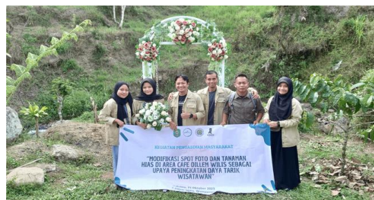
Gambar 10. Proses penyerahan produk dari tim pengabdian kepada mitra

Setelah proses pembangunan spot foto selesai sesuai desain yang ditentukan, selanjutnya dilakukan penyerahan secara resmi dari tim pengabdian kepada mitra yaitu pihak Dilem Wilis Trenggalek. Proses penyerahan ini menandakan proses pengabdian dengan judul “Modifikasi Spot Foto dan Tanaman Hias di Area Cafe Dilem Wilis sebagai Upaya Peningkatan Daya Tarik Wisatawan” selesai dilakukan.