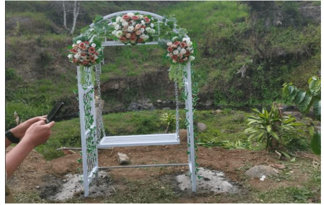
Gambar 8. Spot foto yang sudah dipasang tanaman hias