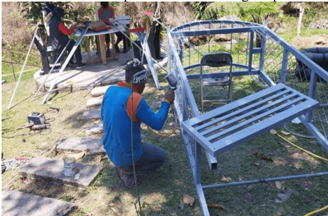
Gambar 6. Proses pengecatan kerangka spot foto

Selanjutnya, kerangka spot foto dipasang pada tempat yang sudah disepakati seperti pada Gambar 7. Kemudian ditambahkan tanaman hias pada kerangka spot foto untuk menambah keindahan dan nilai estetika seperti pada gambar 8. Kegiatan pemasangan kerangka sampai seperti pada Gambar 9 dilakukan mulai pukul 12.00 sampai 15.00.