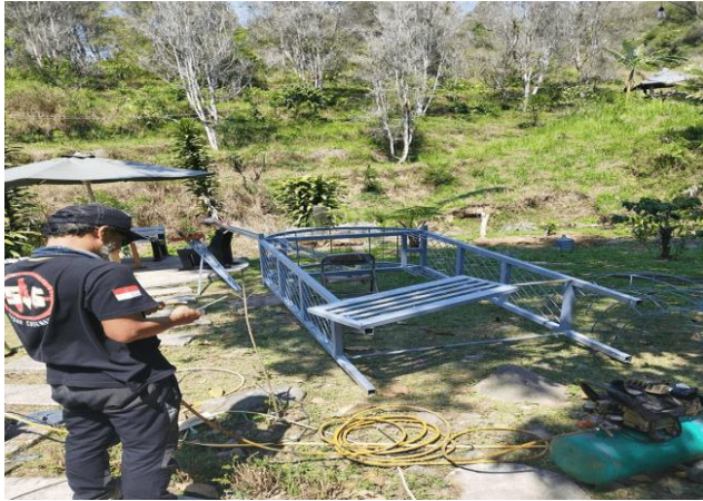
Gambar 5. Proses pembentukan kerangka spot foto