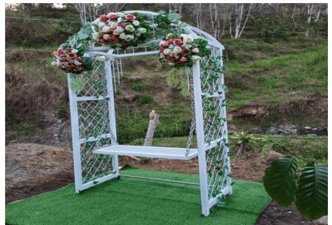
Gambar 9. Hasil akhir spot foto dan tanaman hias

Setelah proses pembangunan spot foto selesai sesuai desain yang ditentukan, selanjutnya dilakukan penyerahan secara resmi dari tim pengabdian kepada mitra yaitu pihak Dilem Wilis Trenggalek. Proses penyerahan ini menandakan proses pengabdian dengan judul “Modifikasi Spot Foto dan Tanaman Hias di Area Cafe Dilem Wilis sebagai Upaya Peningkatan Daya Tarik Wisatawan” selesai dilakukan.