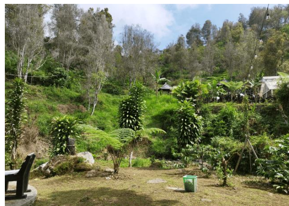
Gambar 3. Area belakang cafe yang menghadap ke sungai

Pada area belakang cafe yang menghadap sungai dan bukit terdapat lahan kosong cukup luas dan cocok untuk tempat penambahan spot foto dan tanaman hias yang ditunjukkan pada Gambar 3.