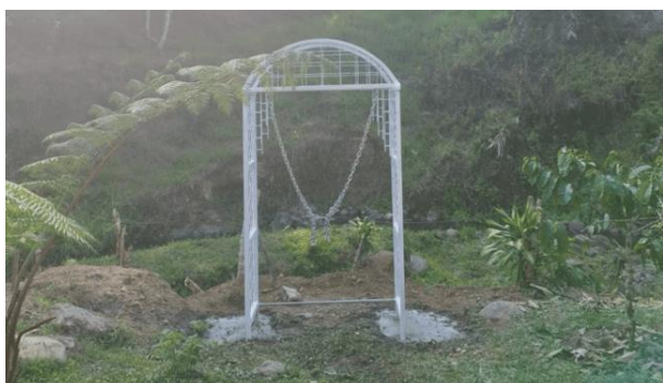
Gambar 7. Kerangka Spot foto yang sudah dipasang

Selanjutnya, kerangka spot foto dipasang pada tempat yang sudah disepakati seperti pada Gambar 7. Kemudian ditambahkan tanaman hias pada kerangka spot foto untuk menambah keindahan dan nilai estetika seperti pada gambar 8. Kegiatan pemasangan kerangka sampai seperti pada Gambar 9 dilakukan mulai pukul 12.00 sampai 15.00.