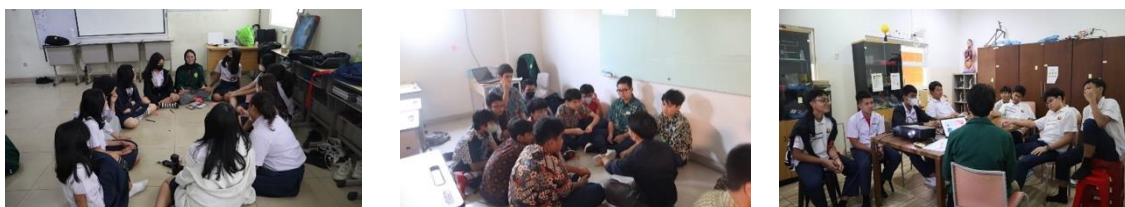
Gambar 2. Cuplikan pelaksanaan kegiatan fase pertama (sesi dua)

Selain berdiskusi, co-fasilitator juga menyampaikan materi tentang cara tepat merawat tubuh, baik dari wajah, badan hingga bagian intim peserta. Co-fasilitator juga menyampaikan batasan-batasan tentang hak dan kewajiban setiap individu terhadap tubuhnya sendiri dan tubuh orang lain. Co-fasilitator memberikan ruang aman dan nyaman bagi seluruh peserta untuk bertanya ataupun membagikan pengalaman atau pengetahuan yang selama ini sudah atau ingin diketahui. Cuplikan pelaksanaan kegiatan sesi dua fase pertama dapat dilihat pada gambar 2.