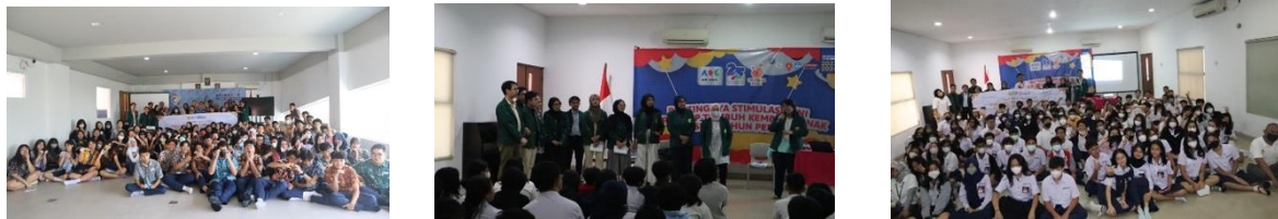
Gambar 1. Cuplikan pelaksanaan kegiatan fase pertama (sesi satu)

kegiatan sesi satu fase pertama dapat dilihat pada gambar 1.