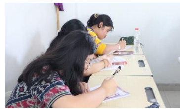
Gambar 4. Cuplikan sesi evaluasi perubahan pengetahuan peserta tentang perawatan diri

Secara umum, hasil evaluasi menunjukkan bahwa peserta mengalami perubahan pengetahuan tentang perawatan diri saat sebelum dan setelah materi diberikan. Sebelum sesi dimulai di fase pertama, skor peserta cenderung rendah dengan rentang nilai 2-5. Namun setelah melalui rangkaian dua sesi materi pada fase pertama, skor peserta cenderung menunjukkan peningkatan dengan rentang nilai 5-9. Informasi selengkapnya dapat dilihat pada tabel 2.