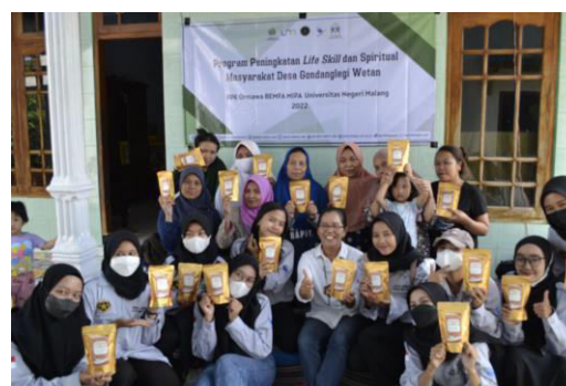
Gambar 2. Produk Hasil Pelatihan Tata Boga Dodol Buah dan Kopi Biji Salak

Kelas pelatihan yang dipersiapkan adalah pelatihan tata boga karena tata boga merupakan hal yang sangat dekat dengan perempuan, sehingga eks PSK tidak perlu memiliki skill lebih dalam mengikut kelas tata boga. Pelatihan tata boga yang disiapkan adalah bentuk olahan samping dari buah salak. Kabupaten Malang merupakan salah satu penghasil komoditas buah salak terbanyak di Jawa Timur. Salak malang memiliki karakter yang berbeda dari salak lain, yakni rasa buahnya manis agak keasaman, berdaging tebal, dan memiliki kandungan air yang lebih banyak. Sehingga hasil komoditas buah salak banyak digunakan sebagai olahan samping selain dinikmati daging buahnya. Olahan samping pada pelatihan kepada para wanita di sekitar eks-Lokalisasi Girun Desa Gondanglegi Wetan yakni produk olahan salak berupa dodol yang memanfaatkan daging buah salak dan kopi biji salak yang memanfaatkan biji dari buah tersebut. Sehingga dalam hal ini optimalisasi pengolahan macam-macam bagian dari buah salak dapat dimanfaatkan secara menyeluruh dan meminimalisir limbah yang dihasilkan. Pemilihan