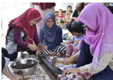
Gambar 2. Pembagian Kelompok Pelatihan

Kelompok merupakan salah satu faktor yang dapat mempengaruhi kinerja setiap anggota. Adanya kelompok dapat menimbulkan jia kompetisi yang berdampak baik pada hasil kerja atau belajar yang dilakukan.