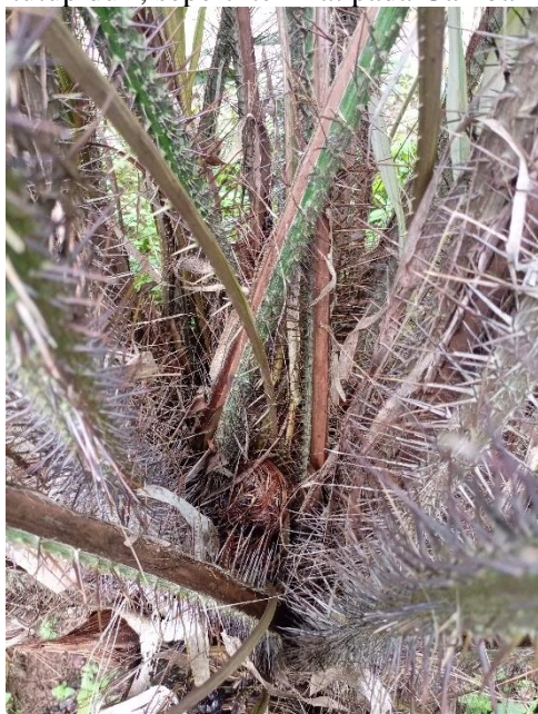
Gambar 1. Buah salak yang akan dipetik terletak di tengah pohon yang berduri.

Pemanenan selektif dilakukan karena buah salak tidak matang secara bersamaan. Buah salak dipanen dengan cara memotong batang tandan. Memilih buah yang tepat untuk dipanen membutuhkan pertimbangan yang matang dari proses panen buah salak. Keranjang bambu digunakan untuk mengumpulkan buah setelah panen, bersama dengan pisau, arit, dan pahat tajam. Biasanya, buah salak yang sudah matang bisa dipetik hanya dengan tangan. Persoalannya, proses pemanenan menjadi sulit ketika buah salak yang perlu dipetik berada di tengah pohon dan tertutup duri, seperti terlihat pada Gambar 1.