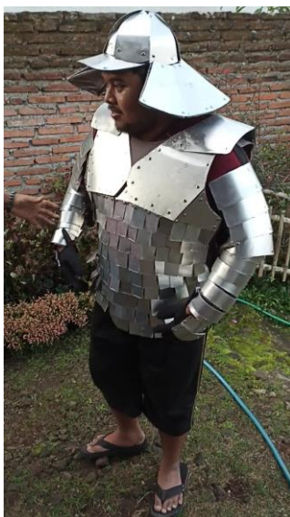
Gambar 8. Wujud Produk Full Plate Armor

Tujuan pengenalan alat/TTG adalah untuk mengetahui tanggapan dan reaksi mitra terhadap karya yang diciptakan khusus untuk partner, yaitu Full Plate Armor. Setelah sebulan pendampingan, mitra melaporkan kemajuan dalam meningkatkan proses memanen salak yang menjadi tujuan utama pengembangan produk Full Plate Armor, yaitu: a) produk berfungsi dengan baik dan bermanfaat bagi pemakainya; b) produk melindungi tubuh petani, khususnya area lengan, tangan, bahu, dan wajah terlindungi dari duri tajam saat memetik buah salak yang sudah berada di tengah pohon dan tertutup duri saat proses memanen; c) produk berfungsi untuk memotong buah salak dengan mudah dari pohonnya; d) produk berfungsi untuk memangkas/membersihkan separuh atau sebagian daun salak dan/atau bagian pohon salak yang tidak lagi bermanfaat bagi tanaman; dan e) aspek yang paling menarik dari Full Plate Armor adalah topinya..