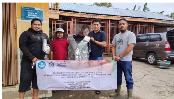
Gambar 11. Foto Bersama Di Sekretariat Kelompok Tani