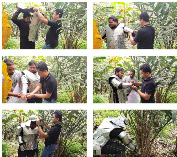
Gambar 10. Introduksi Alat/TTG Full Plate Armor