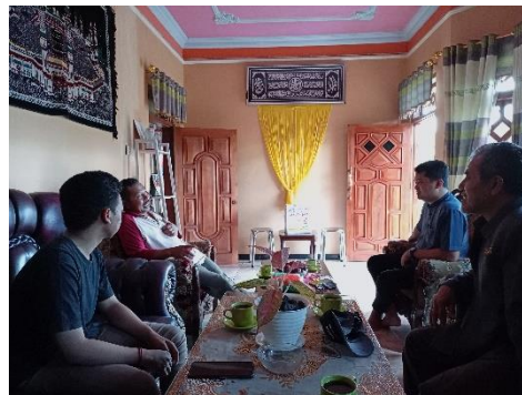
Gambar 4. Pendekatan Sosial

peluang, juga banyak yang ikut-ikutan mencontoh petani yang sukses lebih dulu. Pendekatan sosial kami lakukan dengan cara berkunjung ke rumah-rumah warga, untuk silaturahmi dan memperoleh informasi.