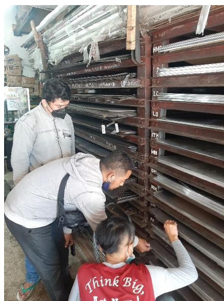
Gambar 5. Pemilihan Bahan

Pengembangan produk Full Plate Armor dilakukan dengan pekerjaan rancang-bangun meliputi: a) pengumpulan data (konsep rancangan, spesifikasi produk, perencanaan material dan prinsip kerja produk); b) pembuatan desain Full Plate Armor, meliputi desain assembly dan desain bagian-bagian komponen pada Full Plate Armor: 1) rongga udara (air cavity), 2) kuningan (brassard), 3) sarung tangan (gauntlet), 4) pelindung dada (breastplate), 5) pelindung siku (elbow cop), dan 6) pisau jari-jari; c) perencanaan elemen, yaitu mengurai raw material di dalam manufaktur produk; dan d) uji coba fungsi di lab./bengkel tempat pengembangan Full Plate Armor.