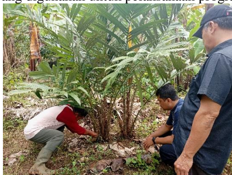
Gambar 3. Survey Lokasi Kebun Salak Mitra

Dari survey lokasi, diperoleh beberapa temuan berikut, meliputi: 1) survey jarak: dari UM ke lokasi mitra sasaran adalah 59,4 km atau 2 jam 14 menit jika ditempuh menggunakan mobil, 2) survey keadaan riil: mitra sasaran memiliki tempat usaha seluas 200 m 2 , kebun salak pribadi seluas 500 m 2 , kebun salak kelompok seluas 300 m 2 , dan kebun salak seluas 10,2 hektar; 3) survey daya tarik lokasi: dekat dengan coban pandawa dan coban tundo, 4) survey fasilitas umum: ada tempat ibadah, dan tempat parkir luas yaitu halaman tempat kelompok tani Kopi Sari yang sering dipakai untuk kegiatan pascapanen dan pengolahan buah salak; 5) survey kondisi lingkungan sekitar: aman, nyaman, sejuk, dan sering hujan; 6) survey arah kebijakan pemerintah setempat: mitra sasaran sering mendapatkan bantuan dari pemerintah seperti teknologi tepat guna dan penyuluhan untuk pengolahan buah salak, 7) survey komitmen mitra terhadap kegiatan tim pelaksana: tim pelaksana dan mitra menyepakati bersama bahwa mitra sanggup untuk berbagi informasi dan sumber daya yang digunakan untuk pelaksanaan program.