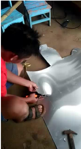
Gambar 6. Pemotongan