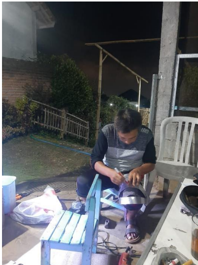
Gambar 7. Pengukuran