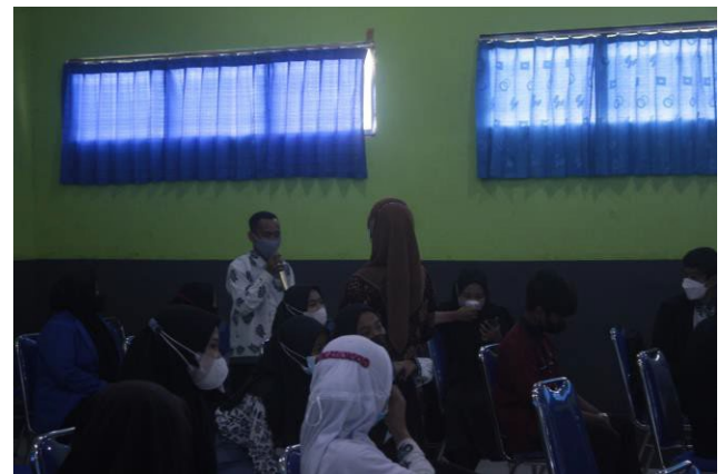
Gambar 2. Sesi tanya jawab oleh siswa SMK Gajah Mada Banyuwangi kepada Dosen Universitas PGRI Banyuwangi

beasiswa Kartu Indonesia Pintar Kuliah (KIP-Kuliah). Selain itu juga dijelaskan persyaratan apa saja yang harus disiapkan ketika ingin mendaftar menjadi calon mahasiswa di Universitas PGRI Banyuwangi. Setelah pemaparan materi dan penambahan beberapa informasi tentang beasiswa, maka kegiatan selanjutnya yaitu tanya jawab, dimana para siswa diberi kesempatan untuk menanyakan segala sesuatu terkait informasi tentang pendidikan tinggi yang ada di Indonesia. Pada sesi tanya jawab ini, terdapat 10 pertanyaan dari beberapa siswa yang berasal dari berbagai jurusan. Antusiasme siswa dalam memberikan pertanyaan tersebut disebabkan karena tema yang dipaparkan sangat sesuai dengan kebutuhan siswa kelas XII yang akan melanjutkan ke jenjang pendidikan tinggi.