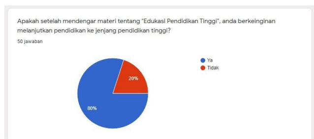
Gambar 5. Diagram antusiasme siswa untuk melanjutkan pendidikan ke jenjang pendidikan tinggi

Ketiga, para siswa memiliki antusias untuk melanjutkan pendidikan ke jenjang berikutnya, hal ini dapat dilihat dari diagram lingkaran pada Gambar 5 bahwa dengan pertanyaan “Apakah setelah mendengar materi tentang Edukasi Pendidikan Tinggi, anda berkeinginan melanjutkan Pendidikan ke jenjang Pendidikan Tinggi?”, 80% siswa menjawab “Ya”.