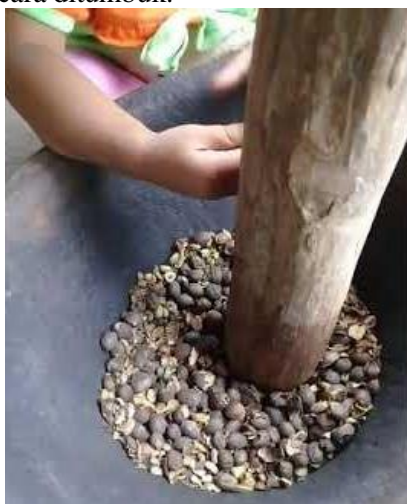
Gambar 1. Mengupas Kulit Kopi Kering Menggunakan Cara Ditumbuk

Potensi kopi di Wilayah Desa Srigading sekitar 300 sd 500 kg per bulan, untuk meminimalisir dampak pandemi dan meningkatkan hasil produktifitas pelaku usaha adalah memanfaatkan teknologi tepat guna dalam proses produksi pengolahan kopi, di Desa Srigading merupakan salah satu penghasil kopi di Malang, tetapi dalam proses produksinya masih menggunakan cara tradisional terutama dalam pengupasan biji kopi dengan cara ditumbuk.