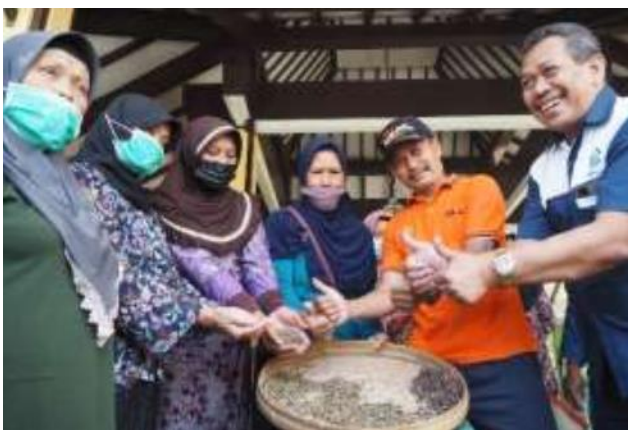
Gambar 5. Dokumentasi Hasil Kupasan Penggunaan Mesin Pengupas Kopi