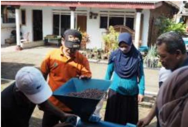
Gambar 4. Dokumentasi Pelatihan Pengoperasian Mesin Kepada Mitra