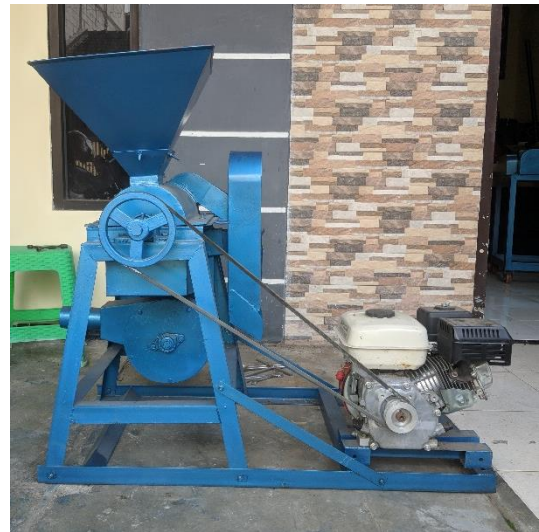
Gambar 3. Mesin Pengupas Kopi

Selelah melalui tahap desain produk mesin pengupas kopi, tahap selanjutnya adalah pengadaan alat dan bahan sebagai material yang digunakan untuk fabrikasi dan manufaktur mesin. Proses manufaktur dan pengujian kinerja mesin membutuhkan waktu kurang lebih 1 bulan. Dalam pengujian mesin pengupas kopi telah memiliki kinerja dan hasil sesuai dengan perencanaan yang diharapkan, yaitu dalam 1 jam dapat mengupas kopi kurang lebih 100kg.