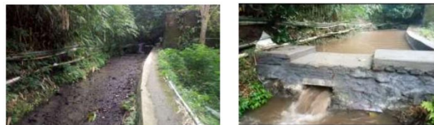
Gambar 3. Pembangunan wahana bermain dengan memanfaatkan air irigasi.

akan lebih bermanfaat saat di tahan dan manfaatnya akan lebih lama di darat.