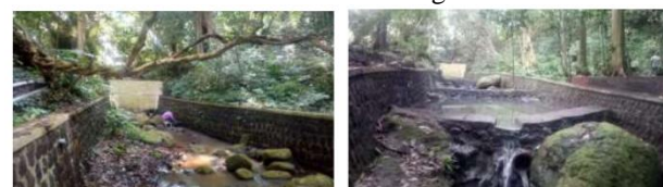
Gambar 4. Pembangunan tanggul-tanggul untuk menambah keindahan sungai.