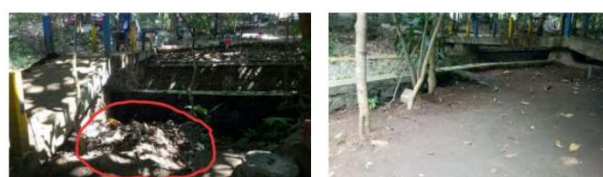
Gambar 5. Pengurukan tempat pembuangan sampah liar guna meminimalisir masyarakat membuang sampah sembarangan

Di samping sosialisasi dan diskusi antara tim pengabdian dan mitra untuk membantu meningkatkan pemahaman masyarakat terhadap kesadaran lingkungan hidup, upaya juga dilakukan untuk menekan potensi membuang sampah sembarangan. Wilayah yang kotor dengan sampah berserakan di lubang dan cekungan dapat memengaruhi psikologis wisatawan untuk ikut membuang sampah sembarangan. Oleh karena itu, cara dilakukan dengan menimbun lubang dan cekungan yang umumnya sebagai tempat buang sampah instan wisatawan. Ini berdampak agar tidak memancing wisatawan dan masyarakat membuang sampah di lokasi tersebut.