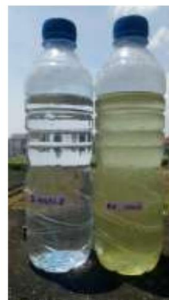
Gambar 2. Pengujian untuk mengetahui air tanah atau air permukaan

menunjukkan bahwa sumber air terpilih Sumbernyolo bersumber dari air tanah dan tidak terkontaminasi alga sehingga memiliki kemungkinan kecil kandungan bakteri E.coli .