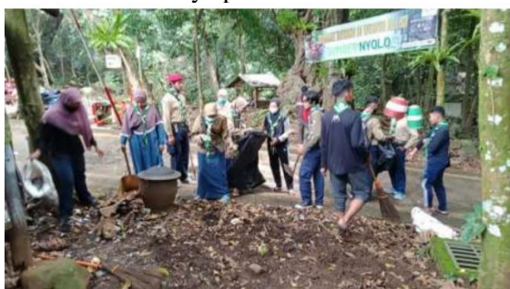
Gambar 6. Bantuan kegiatan kebersihan oleh HNW UMM untuk memengaruhi mental dan sikap pengelola.

pemberikan pengalaman positif bagi wisatawan maupun hosts . Oleh karena itu, menggunakan strategi dengan mengembangkan kebersamaan dinilai lebih efektif memengaruhi psikologis masyarakat sekitar bahwa kawasan Sumbernyolo perlu dijaga bersama. Terlebih lagi, akan menjadi sesuatu hal yang berat bila pengembangan wisata edukasi hanya mengandalkan penyuluhan kepada pengelola. Untuk itu pendampingan secara kontinyu oleh tim terus dilakukan serta bekerja sama dengan organisasi pecinta alam dalam membantu kebersihan khususnya pada event-event tertentu.