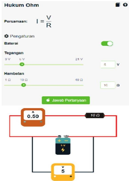
Gambar 1. Tampilan layar praktikum Hukum Ohm Pada akhir kegiatan diberikan angket kepada

materi Hukum Ohm. Kriteria keberhasilan kegiatan ditetapkan jika 75% peserta telah menjawab dengan benar. Tampilan praktikum virtual Hukum Ohm disajikan pada Gambar 1.