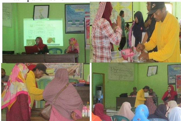
Gambar 1. Sosialisasi dan partisipasi masyarakat

Partisipasi dalam bentuk sosialisasi dan pelatihan: Kelompok petani “Subur Makmur” dan “Serai Wangi” di Kabupaten Konawe Selatan dilibatkan dalam proses sosialisasi baik sebagai masyarakat sasaran maupun sebagai masyarakat mitra (Gambar 1). Hal ini dimaksudkan agar terjadi perubahan pola pikir tentang pentingnya meningkatkan perekonomian dengan memanfaatkan hasil panen sendiri.