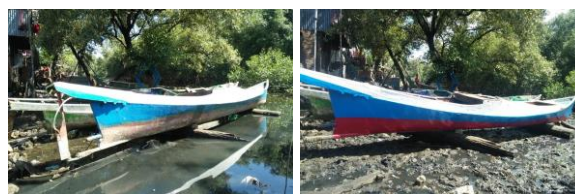
Gambar 4. Perbaikan Perahu Nelayan

Mitra mengalami kesulitan dalam akses permodalan terutama dalam perbaikan sarana produksi seperti perbaikan perahu. Oleh karena itu, tim PKMS berinisiatif memberikan bantuan berupa perbaikan perahu nelayan agar supaya lebih kokoh dan kuat (Gambar 4).