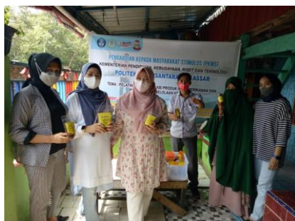
Gambar 5. Pelatihan Diversifikasi Produk Olahan Hasil Perikanan