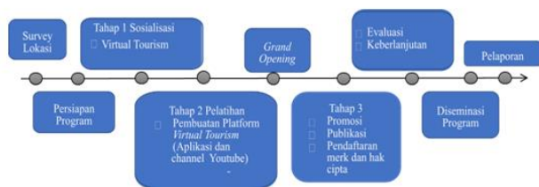
Gambar 3. Roadmap Kegiatan Pengabdian

Setelah Virtual Tourism berhasil dibuat oleh Tim PKM PI, langkah selanjutnya dilakukan workshop pelatihan di Desa Sidowayah. kegiatan ini dilakukan secara luring dengan tetap memperhatikan protokol kesehatan. Kegiatan pelatihan dibagi menjadi 2 sesi dengan pembicara Rysca Indreswari, S.Pt., M.Si dan Muhammad Ainurrasyid Al Fikri. Pelatihan berisi penyampaian materi berupa Digital Marketing dan Website. Penyampaian materi digital marketing berguna untuk mendorong UMKM untuk memanfaatkan website sekaligus teknologi dan penyampaian materi website berguna untuk memperkenalkan website kepada masyarakat . Serta, diadakan pula praktik setelah sesi penyampain materi selesai. Peserta pelatihan diarahkan untuk memfoto produk UMKM yang telah disediakan dengan berbagai kreasi.