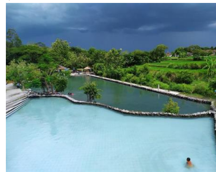
Gambar 2. Umbul Siblarak

Umbul Manten merupakan salah satu tempat wisata air alami, sumber mata air terus mengalir memenuhi cekungan tanah di sekelilingnya. Pemandangan yang asri membuat Umbul Manten memiliki pesona yang luar biasa. Sejak tahun 2015, dikelola oleh Badan usaha Milik Desa (BUMDES) Sidowayah.