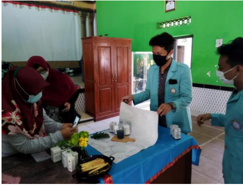
Gambar 4. Workshop Pelatihan

Meskipun kegiatan pengabdian telah diupayakan untuk dilakukan secara maksimal, namun tentu masih terdapat kesulitan yang dilalui oleh mitra dan Tim PKM PI dikarenakan pandemi Covid-19 yang membuat Umbul Manten dan Umbul Siblarak tidak dapat beroperasi. Namun, hadirnya virtual tourism diharapkan mampu menjadi alat bagi Desa Sidowayah untuk menjangkau masyarakat seluas-luasnya di era new normal dan diharapkan mampu menjadi pancingan agar masyarakat tertarik untuk hadir menikmati pesona Umbul Manten dan Umbul Siblarak secara langsung setelah situasi kembali normal.