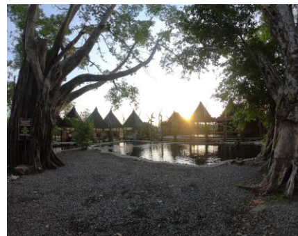
Gambar 1. Umbul Manten

kota klaten bersumber dari lereng Gunung Merapi. Pemanfaatan air juga dioptimasi di sektor persawahan, hingga di sektor pariwisata air dengan memanfaatkan sumber mata air yang dialirkan ke dalam embung atau umbul desa (Rustamaji et.al, ). Potensi sumber mata air yang melimpah dan mengalir sepanjang tahun demikian, secara bijaksana telah dimanfaatkan oleh warga untuk beberapa hal seperti pengembangan wisata air Umbul Manten dan Umbul Siblarak.