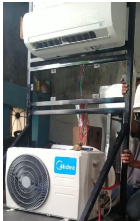
Gambar 4. Pemasangan pipa tembaga AC

Langkah selanjutnya setelah pemasangan pipa adalah pemvakuman. Pemvakuman adalah proses membuang udara yang ada di dalam AC. Siklus AC adalah siklus yang tertutup sehingga tidak boleh ada zat lain selain refrigerant yang bersirkulasi.