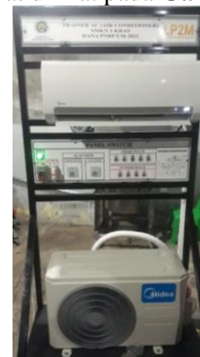
Gambar 3. Unit AC Indoor dan Outdoor yang telah dipasang pada kerangka

menentukan titik-titik yang akan digunakan pada panel switch untuk indoor dan outdoor AC. Pada unit Indoor AC split terdapat terminal-terminal kabel yang terdiri dari power dan kabel balikan. Pada terminal biasanya tertera simbol terminal L (Line), N (netral) dan terminal 1 dan 2. Terminal L dan N pada indoor akan dihubungkan ke sumber tegangan listrik PLN. Terminal 1 dan 2 akan disambungkan ke unit outdoor dengan sebuah kabel (istilahnya kabel balikan). Di dalam unit Outdoor terdapat kompresor, kondensor, fan, dan komponen kelistrikan outdoor. Hasil pemasangan indoor dan outdoor AC dapat dilihat pada Gambar 3 .