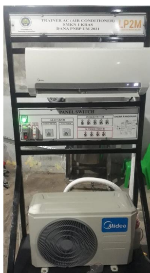
Gambar 8. Pengecekan seluruh instalasi trainer AC