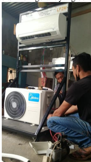
Gambar 5. Pemvakuman AC

Langkah selanjutnya setelah pemasangan pipa adalah pemvakuman. Pemvakuman adalah proses membuang udara yang ada di dalam AC. Siklus AC adalah siklus yang tertutup sehingga tidak boleh ada zat lain selain refrigerant yang bersirkulasi.