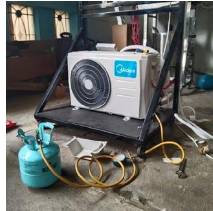
Gambar 6. Pengisian freon AC

Setelah dilakukan pemvakuman, maka langkah selanjutnya adalah pengisian freon AC. Senyawa kimia ini biasa digunakan sebagai bahan pendingin untuk kulkas, AC dan barang elektronik lainnya. Jika tidak ada freon, maka alat elektronik tidak akan memiliki bahan bakar untuk mampu menghasilkan udara yang dingin. Freon berperan sebagai fluida yang mampu menyerap udara kotor atau panas agar suhu di dalam ruangan bisa dikondisikan dengan lebih baik.