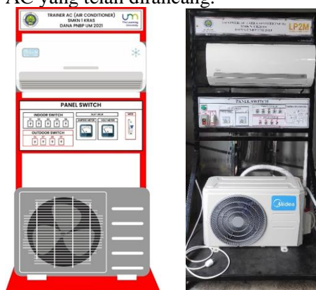
Gambar 2. Desain Trainer AC Gambar 6. Trainer AC

Tahapan selanjutnya adalah pengadaan alat dan bahan yang akan digunakan untuk merakit trainer AC tersebut. Pembuatan/penyusunan kerangka trainer AC dilakukan di bengkel yang dapat merakit kerangka trainer sesuai desain dari trainer AC yang telah dirancang.