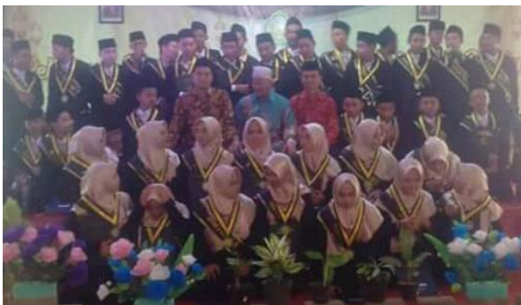
Gambar 1. Para santri dan pengurus saat acara wisuda