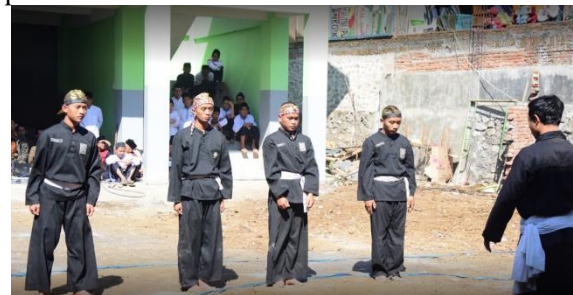
Gambar 2. Salah satu contoh kegiatan ekstrakurikuler seni beladiri

Pada dua poin terakhir kegiatan ekstrakurikuler di ponpes Sabilur Rosyad, mendapatkan perhatian khusus dari tim pengusul proposal ini. Hasil kajian dan observasi tim menemukan bahwa terdapat 20 orang santri yang memiliki minat dan bakat di bidang otomotif. Mereka memiliki hobi pada kendaraan roda dua atau sepeda motor. Mereka sudah memasuki usia produktif. Usia produktif berpengaruh pada tingkat kesejahteraan seseorang apabila dibekali dengan pengetahuan dan keterampilan yang mumpuni (Hadi & Dewi, 2019). Oleh karena itu, mereka perlu dibekali pengetahuan dan keterampilan untuk mengembangkan minat dan bakatnya. Apalagi track record pesantren sejak dulu sangat baik, karena telah menyumbangkan banyak bibit unggul terutama dalam dunia pendidikan (Rokhman, 2017). Lebih lanjut lagi, potensi tersebut apabila difasilitasi maka dapat menjadi peluang yang dapat meningkatkan nilai produktivitas mereka.