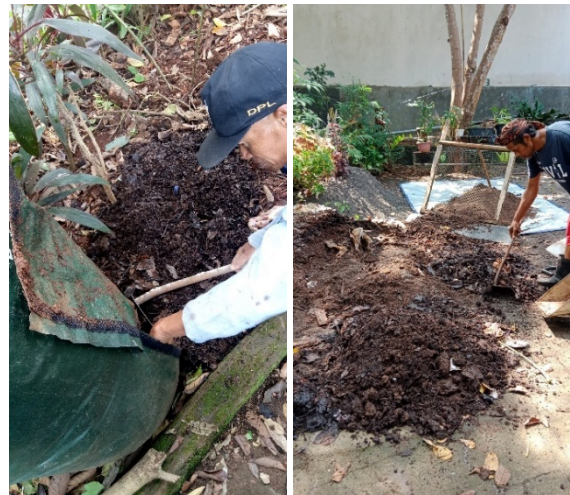
Gambar 9. Pemanenan kompos

Pada saat monitoring keberlanjutan program, tim pengabdian melakukan pengecekan dan pendampingan masyarakat dalam melakukan composting . Para peserta kegiatan pengabdian yang sebelumnya mengikuti pemaparan materi dan praktek, telah mampu melakukan composting secara mandiri. Mereka telah mampu mengelola sampah dapur dan sampah organik di sekitar rumah. Ada warga yang telah memanen kompos buatannya, namun karena hasilnya baru sedikit maka hanya digunakan sendiri untuk memupuk tanaman sendiri (Gambar 9). Kompos yang telah jadi berwarna hitam dan berbau tanah. Kompos yang dihasilkan digunakan untuk menanam bibit sayuran dalam wallplanter . Sayuran yang ditanam ada daun bawang, sawi, dan seledri.