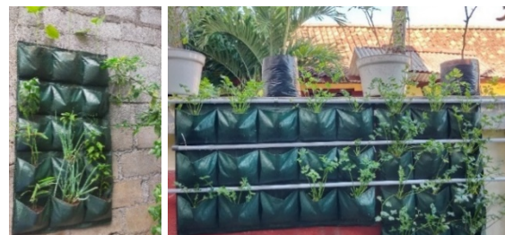
Gambar 11. Hasil penanaman di wallplanter