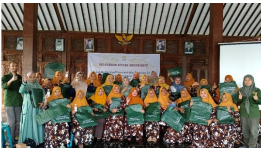
Gambar 8. Peserta mendapatkan compost bag , EM4, wallplanter

Di akhir kegiatan praktek composting , tim pengabdian memfasilitasi peserta dengan membagikan compost bag , cairan EM4 dan wallplanter supaya peserta dapat langsung melakukan sendiri di rumahnya masing-masing (Gambar 8). Diharapkan masyarakat dapat secara mandiri mengelola sampah organik rumah tangganya sehingga dapat mendukung tercapainya program pembangunan desa berkelanjutan.