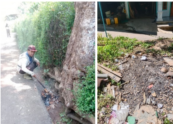
Gambar 4. Pembakaran sampah rumah tangga dan daun kering

Sebagian warga yang memiliki lahan yang luas memilih untuk membuat lubang sebagai tempat pembuangan sampah, sedangkan mereka yang tidak memiliki lahan yang cukup mengandalkan petugas pengangkut sampah untuk membuang sampah rumah tangga mereka. Sayangnya, seringkali sampah hanya dibuang begitu saja di lahan kosong, menyebabkan bau tak sedap, merusak estetika, dan berpotensi menimbulkan masalah kesehatan serta menjadi sumber penyakit. Berdasarkan informasi yang diperoleh dari warga Desa Rejosari, hal ini disebabkan sebagian besar dari mereka belum memahami cara mengelola sampah organik yang dihasilkan dari kegiatan sehari-hari. Tim pengusul juga mengamati bahwa di setiap rumah warga tidak terdapat kantong atau tong kompos.