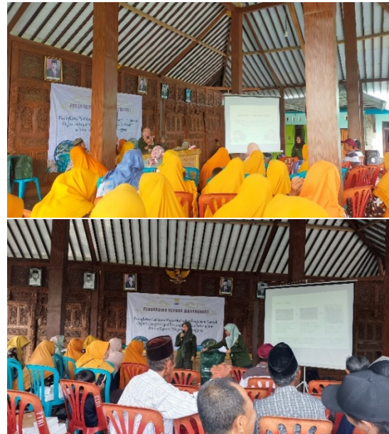
Gambar 6. Penyampaian Materi oleh tim PKM

mengenai pemilahan dan pengolahan sampah rumah tangga, 10 peserta sudah mengetahui dan 20 dari peserta telah mengetahui pemilahan sampah namun belum mengetahui cara pengolahannya. Selain itu, 40 dari jumlah peserta yang hadir belum mengetahui mengenai cara pembuatan kompos yang mudah. Peserta pengabdian sangat antusias dengan materi yang disampaikan, ditandai dengan banyaknya peserta yang bertanya pada sesi tanya jawab.