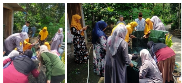
Gambar 10. Penanaman bersama