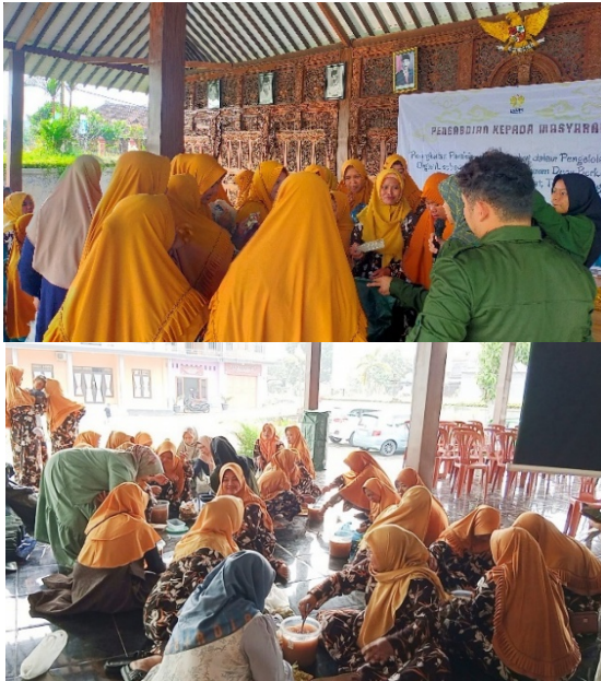
Gambar 7. Praktek pembuatan kompos dan eco-enzyme

semua peserta meningkat mengenai manfaat kompos, eco-enzyme dan cara pembuatannya. Kemudahan membuat kompos dan eco-enzyme dirasa mudah (10) dan sangat mudah (40) oleh peserta. Lebih dari 25 orang peserta berencana akan menyebarkan pengetahuan dan ketrampilan yang mereka dapatkan kepada orang lain dan semua peserta berkeinginan untuk membuat lagi di rumah masing-masing.