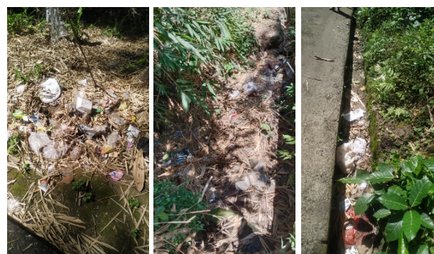
Gambar 3. Tumpukan sampah rumah tangga bercampur dengan sampah organik di lahan kosong (lahan tidak produktif)

https://sipsn.menlhk.go.id/sipsn/public/data/komposisi