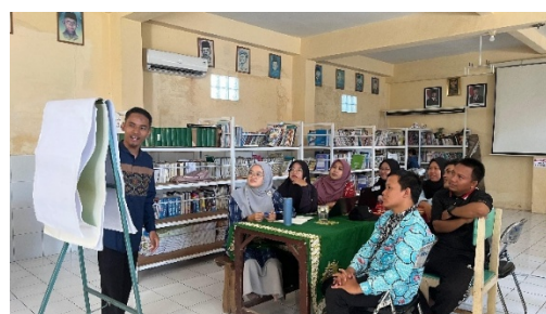
Gambar 11. Kegiatan lesson study dan rencana pembentukan kelompok peer teaching

Kepala sekolah dari ketiga lembaga mitra melaporkan adanya perubahan signifikan dalam pola interaksi guru dan siswa. Pembelajaran yang semula bersifat satu arah kini mulai menampilkan dinamika dua arah, dengan siswa lebih sering terlibat dalam dialog dan kerja kelompok. Selain itu, guru juga lebih reflektif dalam merencanakan dan mengevaluasi pembelajaran. Kegiatan lesson study mini yang difasilitasi oleh FGM menjadi wadah baru bagi guru untuk berbagi praktik baik ( best practices ) hasil dari kegiatan pengabdian.