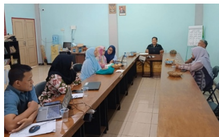
Gambar 2. Rapat koordinasi dan penyamaan persepsi

inovatif. Koordinasi awal ini menjadi dasar bagi penyusunan instrumen kebutuhan ( need assessment ) serta perumusan strategi pelatihan yang relevan dengan konteks sekolah.