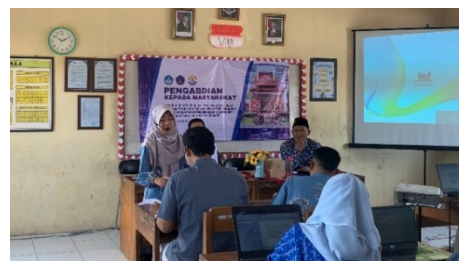
Gambar 8. Simulasi pengelolaan kelas oleh guru dalam proses pelatihan

Hasil dokumentasi menunjukkan bahwa metode pelatihan berbasis praktik dan refleksi kelompok memberikan efek positif terhadap dinamika belajar peserta. Proses evaluasi formatif di setiap akhir sesi digunakan untuk menilai pemahaman peserta terhadap materi yang diberikan dan mengidentifikasi aspek-aspek yang perlu diperbaiki sebelum sesi berikutnya dilaksanakan. Hal ini membuat proses pelatihan bersifat adaptif dan kontekstual terhadap kebutuhan peserta di lapangan.