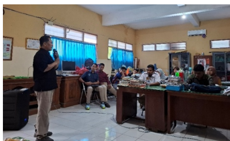
Gambar 7. Refleksi dan rencana tindak lanjut program bersama FGM Kabupaten Buleleng