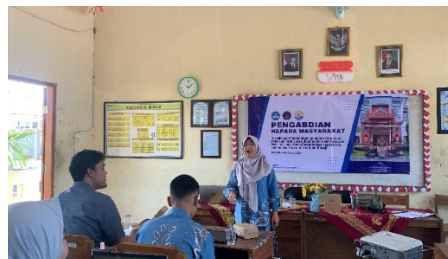
Gambar 4. Penyampaian materi pelatihan

pelajaran yang mereka ampu. Produk hasil pelatihan meliputi lembar kerja digital, kuis interaktif, dan media visual sederhana yang digunakan sebagai alat bantu pengajaran.