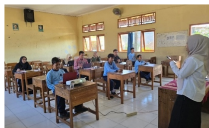
Gambar 5. Kegiatan mentoring dan observasi awal

Guru diberikan kesempatan untuk mempraktikkan hasil pelatihan dengan didampingi oleh mentor. Observasi menunjukkan bahwa 70% guru telah mampu menerapkan prinsip pengelolaan kelas berbasis kolaboratif dan menerapkan disiplin positif kepada siswa.