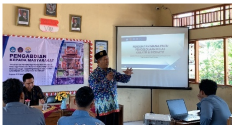
Gambar 3. Penyampaian materi pelatihan

Selama pelatihan, tim pengabdian menghadirkan trainer guru penggerak yang juga aktif memberikan pembinaan di asosiasi profesi FGM Kabupaten Buleleng. Pelatihan ini dirancang bersama narasumber dalam menjawab permasalahan yang dihadapi guru. Olehnya itu, pelatihan ini menggunakan pendekatan interactive learning dan role play untuk mensimulasikan dinamika nyata di kelas.