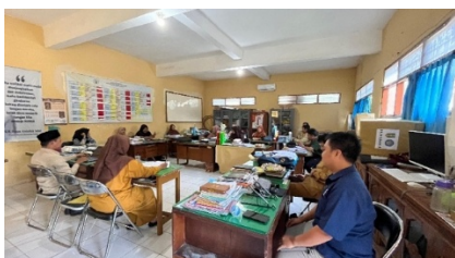
Gambar 6. Kegiatan penilaian dampak program bersama FGM Kabupaten Buleleng