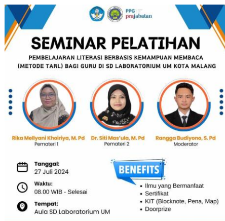
Gambar 1. Desain e-panflet yang disebarakan di media sosial

menyiapkan materi pelatihan, media pelatihan, dan instrumen yang digunakan