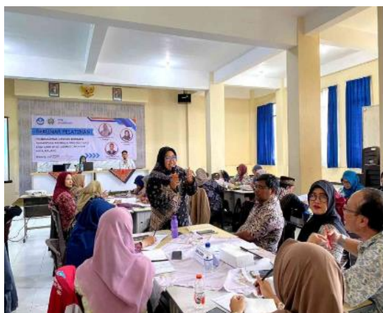
Gambar 2. Penyampaian Materi I