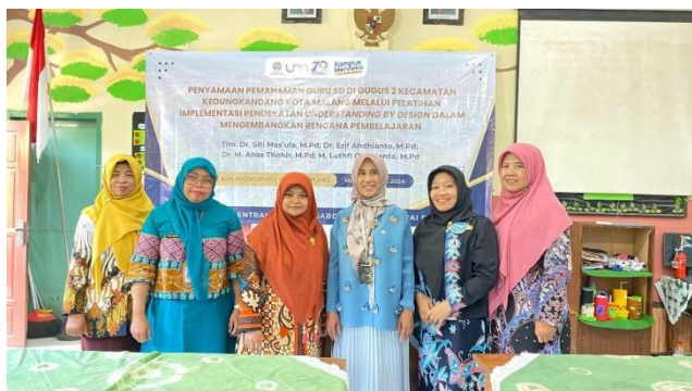
Gambar 4. Foto Bersama Kepala Se-Gugus 2 Kecamatan Kedungkandang

Tahap pelaksanaan pengabdian masyarakat di sekolah merupakan langkah yang sangat penting dalam meningkatkan kualitas pendidikan. Pada tahap ini, pelaksana harus mengimplementasikan rencana yang telah disiapkan dengan menggunakan pendekatan Understanding by Design (UbD). Selain itu, pelaksana juga harus mempersiapkan segala persiapan baik administrasi maupun peralatan serta fasilitas pelaksanaan pelatihan untuk memastikan bahwa semua aspek yang relevan telah dipertimbangkan dan siap untuk digunakan dalam proses pelatihan (Rendra, 2022).