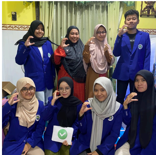
Gambar 3. Dokumentasi Bersama Para Pengajar TPQ Al-Hakim

Selanjutnya, sebagai bentuk monitoring untuk menilai perubahan sikap para santri TPQ, tim membuat produk ceklis Anti-Bullying yang harus diisi setiap hari oleh pengajar TPQ Al-Hakim. Saat tidak ada bullying di hari tersebut, maka pengajar bisa menulis ceklis. Ketika terjadi bullying di hari tersebut, maka pengajar bisa menuliskan tanda silang. Di akhir kegiatan, dilakukan penyerahan hadiah kepada para peserta penyuluhan sekaligus penyerahan konsumsi kepada para pengajar TPQ Al-Hakim. Setelahnya dilanjutkan dengan sesi dokumentasi bersama antara tim pengabdian dan pengajar TPQ Al-Hakim.