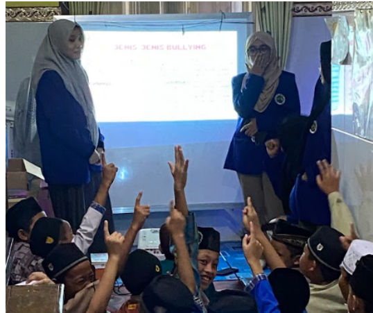
Gambar 2. Antusias Para Santri Dalam Sesi Pemaparan Materi dan Tanya Jawab

Kegiatan diawali dengan pembukaan berisi penghormatan kepada pihak pengajar TPQ Al-Hakim dan juga perkenalan tim penyuluhan yang berisikan 6 anggota. Dilanjutkan dengan sesi penyampaian materi oleh anggota tim sebagai narasumber melalui PowerPoint dengan metode ceramah. Judul materi yang disampaikan adalah “Hentikan Bullying, Bersama Kita Ciptakan Hari Cemerlang” dengan harapan bullying dapat dihentikan dan menciptakan hari-hari yang bahagia bagi semua orang. Kemudian, para peserta diberikan materi tentang definisi bullying , jenis-jenis bullying , tempat terjadinya bullying , faktor penyebab bullying , dampak pada korban bullying , dampak pada pelaku bullying , dan pencegahan bullying . Materi penyuluhan diberikan selama 20 menit dengan cara ceramah yang interaktif dengan sesi tanya jawab seputar bullying sebelum masuk ke pemaparan materi.