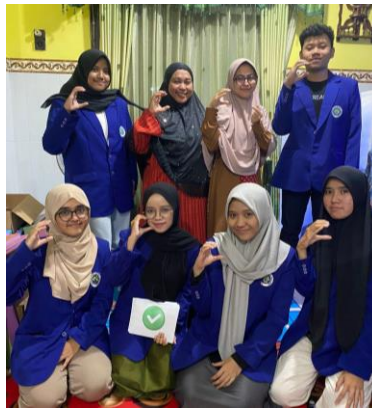
Gambar 2. Dokumentasi Bersama Para Pengajar

Selanjutnya diakhir kegiatan tim pengabdian memberikan lembar checklist kepada para pengajar TPQ Al-Hakim untuk mengawasi kejadian bullying yang terjadi pada para santri di TPQ. Lembar checklist tersebut dapat diisi dengan tanda checklist (✓) oleh pengajar jika dalam 1 hari kejadian bullying pada para santri di TPQ Al-Hakim sangat minim bahkan tidak ada perilaku bullying sama sekali. Tetapi ketika terjadi bullying di hari tersebut, maka pengajar bisa menuliskan tanda silang (✗). Selain itu, tim pengabdian meminta kepada para pengajar agar setiap hari memberikan edukasi terkait bullying di sela-sela mengaji, yang mana nantinya materi edukasi terkait bullying berasal dari tim pengabdian yang diberikan setiap hari Jumat. Kemudian sebelum penutup dilakukan pembagian konsumsi kepada para pengajar yang dilanjutkan dengan sesi dokumentasi bersama dan diakhiri dengan penutupan.