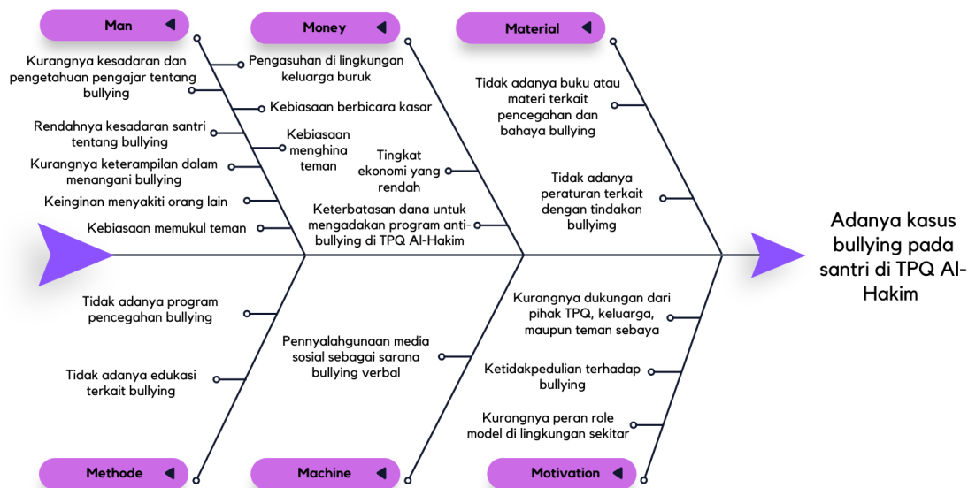
Gambar 1. Diagram Fishbone

Berdasarkan analisis fishbone diatas, diperoleh bahwa pada aspek man , penyebab masalah yang terjadi adalah kurangnya kesadaran dan pengetahuan pengajar mengenai pencegahan dan penanggulangan bullying, rendahnya kesadaran santri tentang bullying,