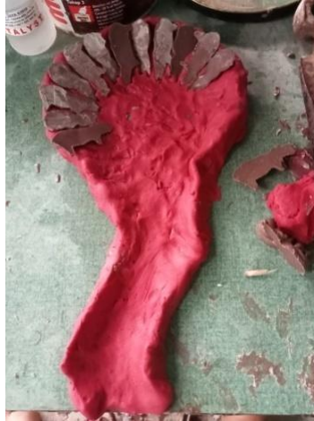
Gambar 9: Foto Rancangan kaki