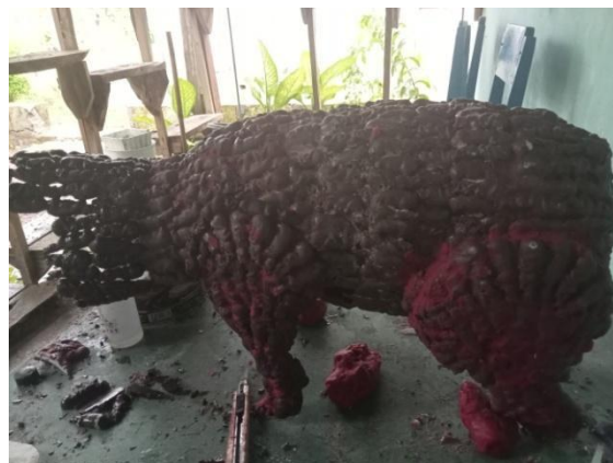
Gambar 11: Foto kaki telah terpasang