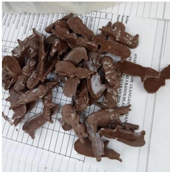
Gambar 2. Patung yang baru keluar dari cetakan