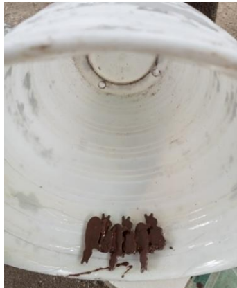
Gambar 4. Obyek patung yang ditata sesuai komposisi