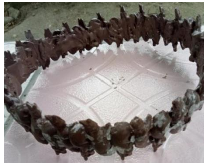
Gambar 7. Obyek patung yang ditata dan dilem dengan fiberglas