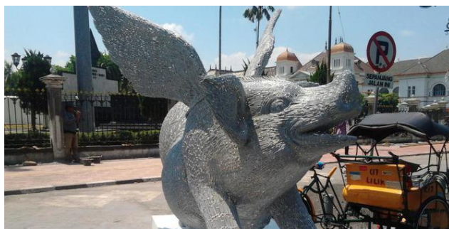
Gambar 1: Patung babi bersayap.

Hari ini, Jumat (04/10) warga Yogyakarta yang melewati Jalan Malioboro dikejutkan dengan pemandangan baru berupa patung-patung karya seni kontemporer yang baru dipajang di sana oleh Jogja Nasional Museum. Salah satu patung yang mengundang perhatian adalah tiga buah patung babi bersayap berwarna silver yang terbuat dari paku-paku. Paku-paku itu dilas, hingga membentuk patung babi. Patung diletakkan di sekitaran titik nol.