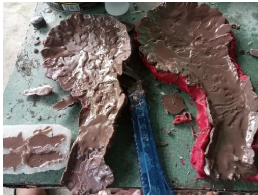
Gambar 10: Foto Rancangan kaki kanan dan kiri