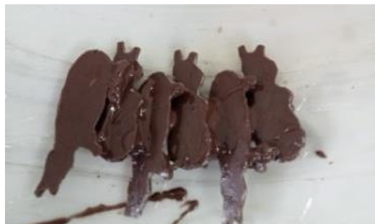
Gambar 5. Obyek patung yang ditata dan dilem dengan fiberglas

Bentuk bagian dari patung yang telah ditata membentuk lingkaran terdahulu untuk mempermudah mempermudah bentuk selanjutnya. Bentuk lingkaran tersebut sebagai patokan bentuk-bentuk selanjutnya, sekaligus juga menentukan besaran patung yang direncanakan.