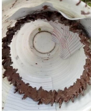
Gambar 6. Obyek patung yang ditata dan dilem dengan fiberglas