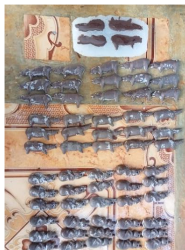
Gambar 3. Patung yang sudah ditata berdasarkan posisinya