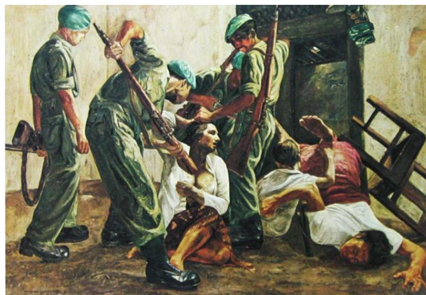
Gambar 5. Lukisan Realis karya Dullah, judul Praktek Tentara Pendudukan Asing Koleksi Lukisan-lukisan dan Patung Koleksi Presiden Sukarno

Judul lukisan merupakan tanda yang dipergunakan oleh pelukis untuk menamai karya seni lukis yang diciptakannya, yang dapat menyiratkan secara singkat isi/tema karya seni lukis tersebut.