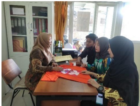
Gambar 2. Diskusi pengembangan

Setiap anak memiliki minat dan bakat yang berbeda sehingga perlu diidentifikasi minat mereka dan memberikan kesempatan untuk mengembangkan bakat dalam membantu mereka menjalani proses berwirausaha. Hal tersebut tidak dapat terlepas dari dukungan orang tua dan penguatan skill . Langkah yang disediakan sekolah yaitu dengan memberikan pendidikan dan pelatihan melalui pelajaran seni budaya. Anak-anak dikenalkan dengan program komputer dan kemampuan dalam menyablon sederhana, namun karena keterbatasan keilmuan kurangnya optimalisasi pemanfaatan teknologi dalam mendukung kegiatan tersebut. Berikut adalah hasil karya anak berkebutuhan khusus dalam berkarya sablon.