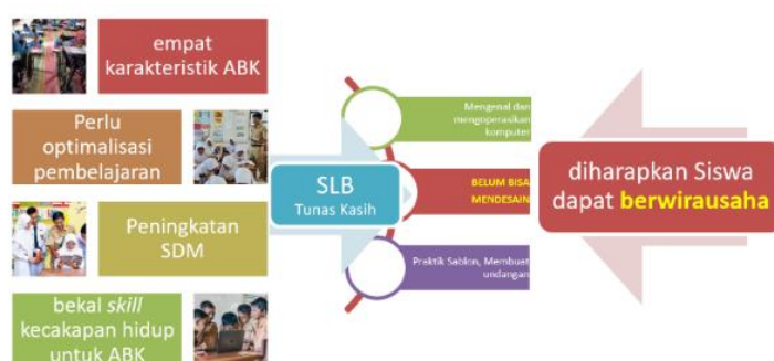
Bagan 1. Permasalahan

Anak berkebutuhan khusus memiliki hak yang sama untuk memperoleh pendidikan yang layak, namun pada kenyataannya layanan pendidikan kurang optimal, salah satu penyebabnya adalah kurang optimalnya penggunaan media pembelajaran yang disesuaikan dengan anak berkebutuhan khusus baik segresif maupun inklusif [4] . Sumber daya manusia (SDM) pada sisi guru belum seluruhnya memiliki kompetensi penguasaan materi keterampilan khusus karena latar belakang pendidikan SDM dari jurusan SLB [5] . Sebagian besar guru merupakan guru kelas, dan belum seluruhnya mengikuti pelatihan pendalaman penguasaan pembelajaran keterampilan seperti desain, dan kerajinan. Disisi lain untuk meningkatkan kecakapan dan menghasilkan ekonomi secara mandiri harus memiliki skill [6] . Keempat topik tersebut memiliki urgensi tersendiri terutama pada lembaga pendidikan sebagai tempat belajar anak.