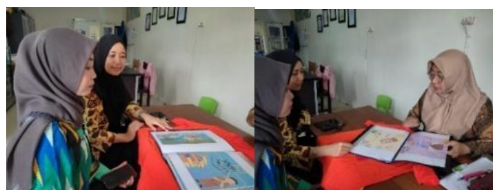
Gambar 4. Desain Siswa SMALB Tunas Kasih

Mendesain merupakan keterampilan yang dibekali melalui pembelajaran seni budaya, hasil dari observasi studi kasus karya siswa, semuanya tertarik dengan mendesain, namun keterbatasan kemampuan anak dalam memahami aplikasi desain membuat karya yang mereka hasilkan terbatas. Hal tersebut karena anak berkebutuhan khusus belum menggunakan aplikasi yang lebih mudah namun dapat dimanfaatkan untuk pengembangan desain secara mandiri sehingga dapat menghasilkan karya yang orisinal.