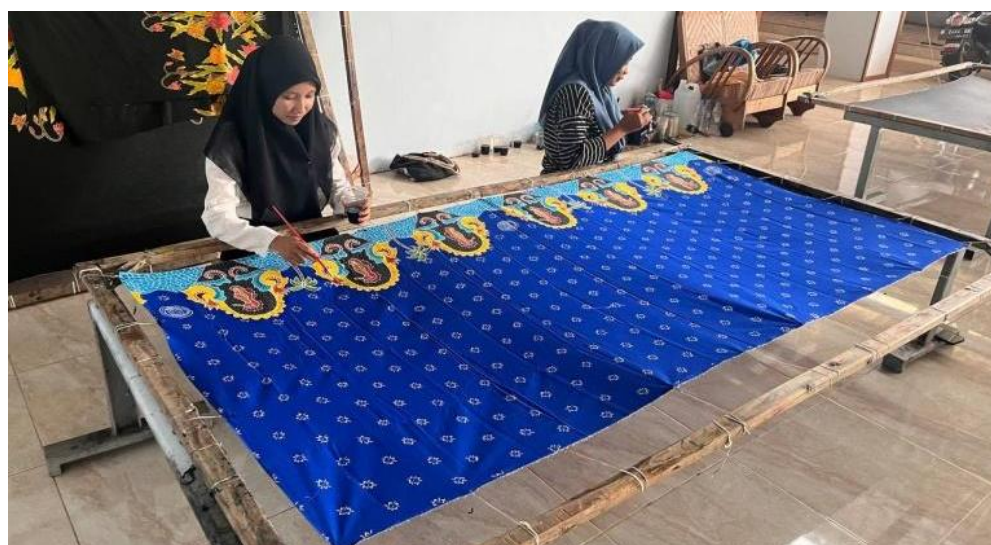
Gambar 7: Proses pewarnaan dengan teknik colet

Selanjutnya proses pewarnaan kain dengan teknik colet dengan bantuan kuas khusus atau spons basah. Pewarnaan menggunakan pewarna remasol. Tahap berikutnya kain dikunci dengan waterglass lalu didiamkan beberapa hari. Kemudian kain siap dibersihkan dari zat lilin/malam yang menempel menggunakan air panas, kegiatan ini disebut proses ngelorod , dan kain dibilas dengan air mengalir hingga bersih. Kain kemudian memasuki proses pengeringan yaitu kain dijemur kembali di tempat yang tidak terpapar langsung dari sinar matahari. Tahap akhir adalah kain siap untuk dijahit.