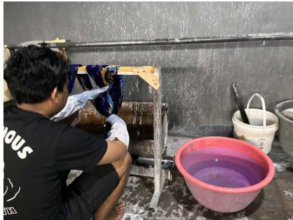
Gambar 8: Proses penguncian warna dengan waterglass