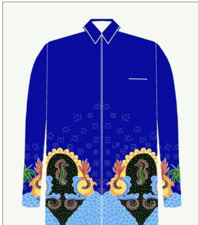
Gambar 4: Mock up yang dibuat secara digital melalui iPad (sumber: dokumentasi pribadi, 2023)

Langkah selanjutnya adalah menerapkan desain motif batik menjadi selebar kain. Pertama , motif batik divisualkan pada selebar kertas kalkir, kemudian diaplikasikan pada kain. Tahapan selanjutnya adalah proses nyanthing yakni memberi lilin/malam panas.