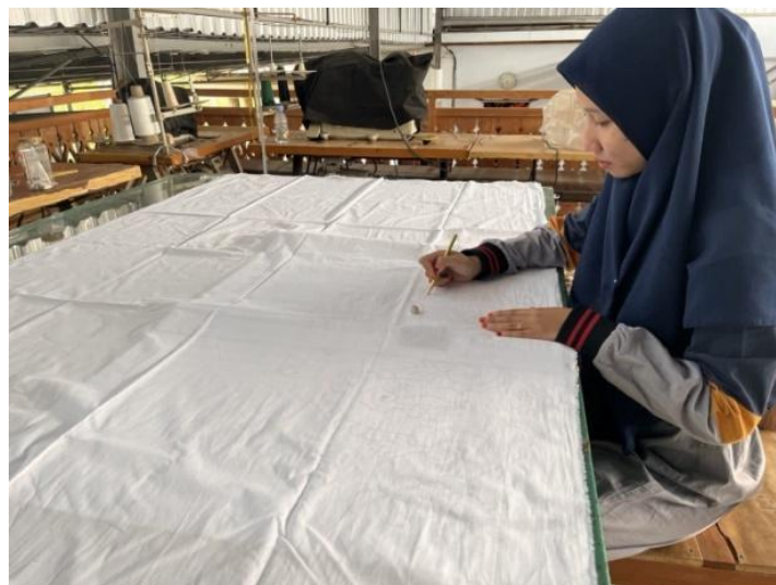
Gambar 5: Proses memindah sketsa dari kertas kalkir ke kain

Langkah selanjutnya adalah menerapkan desain motif batik menjadi selebar kain. Pertama , motif batik divisualkan pada selebar kertas kalkir, kemudian diaplikasikan pada kain. Tahapan selanjutnya adalah proses nyanthing yakni memberi lilin/malam panas.