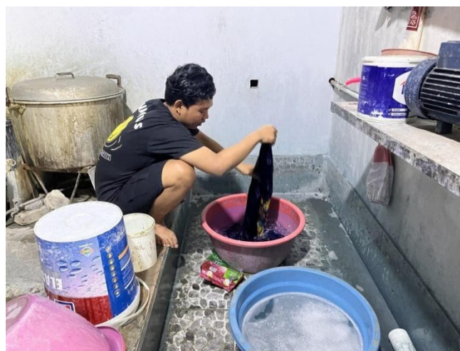
Gambar 10: Proses mencuci kain