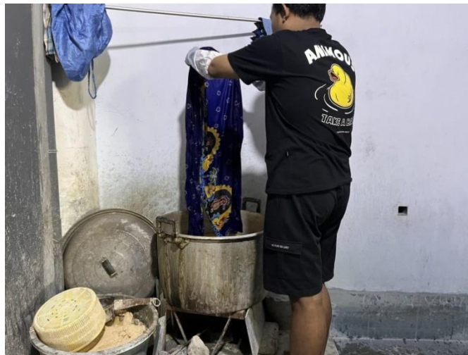
Gambar 9: Proses ngelorod kain