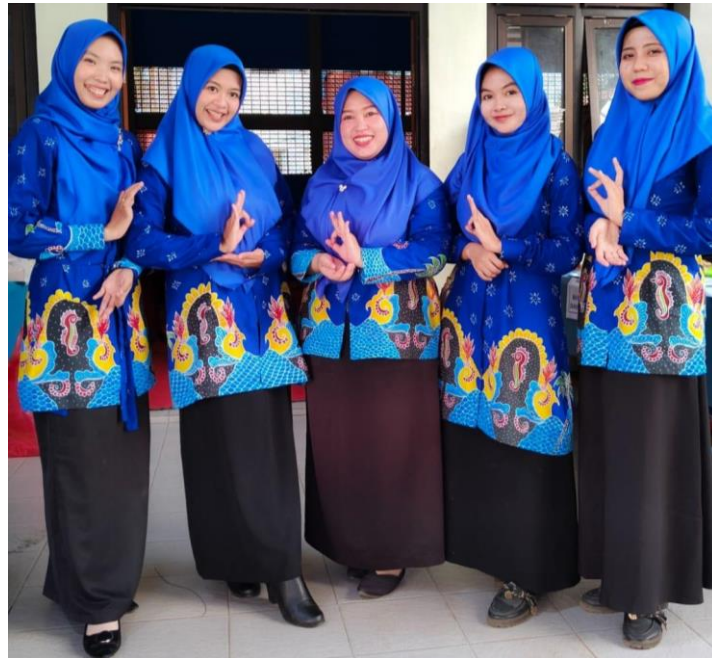
Gambar 12: Kain yang sudah dijahit