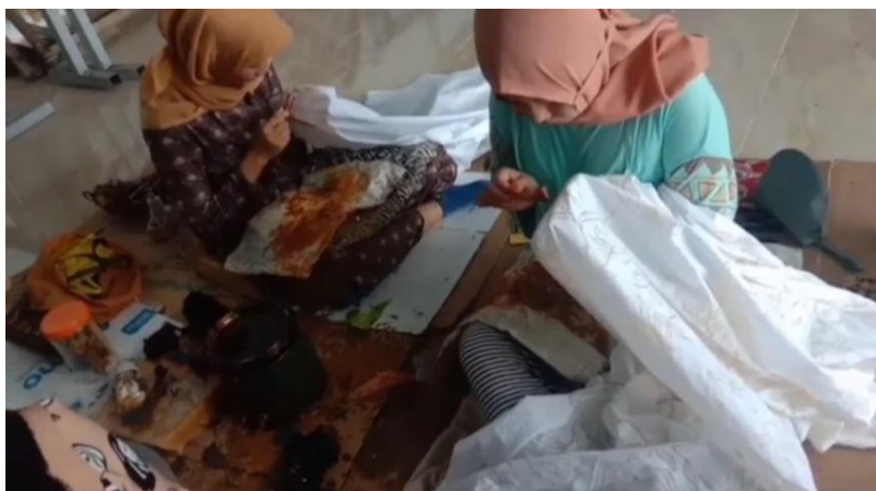
Gambar 6: Proses nyanthing

Selanjutnya proses pewarnaan kain dengan teknik colet dengan bantuan kuas khusus atau spons basah. Pewarnaan menggunakan pewarna remasol. Tahap berikutnya kain dikunci dengan waterglass lalu didiamkan beberapa hari. Kemudian kain siap dibersihkan dari zat lilin/malam yang menempel menggunakan air panas, kegiatan ini disebut proses ngelorod , dan kain dibilas dengan air mengalir hingga bersih. Kain kemudian memasuki proses pengeringan yaitu kain dijemur kembali di tempat yang tidak terpapar langsung dari sinar matahari. Tahap akhir adalah kain siap untuk dijahit.