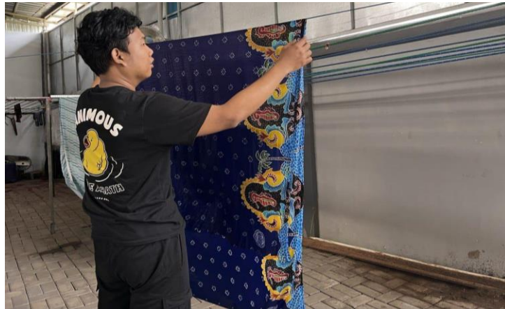
Gambar 11: Kain dalam proses pengeringan