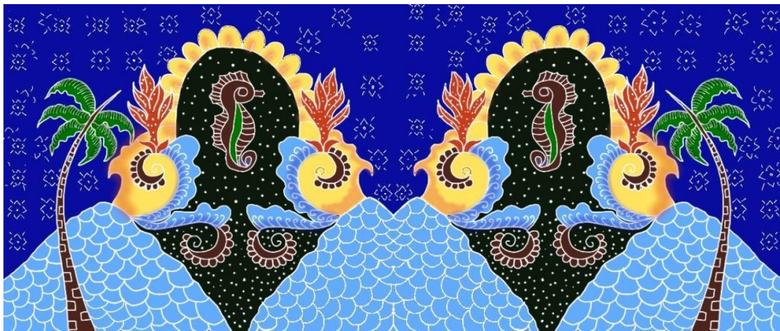
Gambar 3: Sketsa final yang dibuat secara digital melalui iPad

Tahap perwujudan merupakan tahap akhir dalam proses penciptaan karya seni. Pada tahap ini yang dilakukan adalah mengembangkan/menghaluskan sketsa yang telah dipilih untuk dijadikan desain dalam proses pengerjaan. Tampilan warna-warna cerah dirasa memiliki daya tarik lebih yang diharapkan mampu menghidupkan makna desain motif batik yang menjadi ciri khas Kabupaten Probolinggo. Motif batik yang ditampilkan adalah motif bunga g enggong, unsur pesisir seperti kuda laut, ombak pantai dan pohon kelapa. Warna dan motif yang dikembangkan memiliki makna filosofis antara lain: warna biru secara psikologis melambangkan perdamaian, keamanan dan kepercayaan; bunga ganggong melambangkan kemakmuran dan umur panjang; laut sebagai simbol khas pesisir Kabupaten Probolinggo; kuda laut melambangkan kesetiaan; isen-isen 9 bintang lambang Nahdlatul Ulama. Nah, berdasarkan langkah-langkah yang telah disebutkan di atas, inilah sketsa akhir yang dirancang secara digital menggunakan aplikasi Procreate iPad Air Gen 5 dan desain mock up.