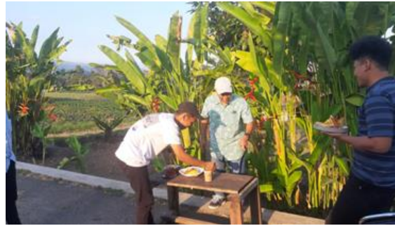
Gambar 4. Pelatihan plating

d). Pelaksanaan Pelatihan Foodstyling, Pelatihan Foodstyling diawali dengan dengan pemaparan tentang pengantar perkembangan kafe dengan pemateri dari ketua tim PKM, kemudian dilanjutkan dengan penjelasan tentang foodstyling oleh tim PKM lainnya. Setelah itu, dilanjutkan dengan pendekorasi / plating berbagai menu makanan dan minuman sesuai kesepakatan dengan mitra, yang dilakukan oleh tim dari kafe lumbung. Selanjutnya tim PKM memulai demo penataan hasil plating dengan menata di atas meja. Secara detail mengenai plating dan foodstyling harus memiliki konsep yang jelas. Seperti di kafe Lumbung orientasi konsepnya lebih dekat kepada alam dengan warna-warna yang alami, namun harus ada kontras pada plating dibandingkan dengan lingkungan sekitar. Sehingga berkesan menjadi obyek utama dan menarik perhatian. Buah stroberi bisa mejadi aksen yang menarik untuk diletakkan disetiap menu makanan dan minuman.