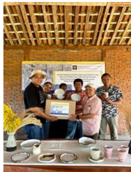
Gambar 7 . Penyerahan hasil produk tableware kepada mitra

3). Paska Kegiatan, paska kegiatan berupa kegiatan penyerahan hasil berkarya keramik tableware untuk kebutuhan peningkatan tampilan sajian menu makanan dan minuman di Kafe Lumbung Bumdes Raharjo Desa Pandanrejo Kota Batu. Adapun yang diserahkan adalah sejumlah total 24 buah keramik, dengan rician : piring 3 model, masing-masing 4 buah, cangkir dan gelas 3 model masing-masing 4 buah, jadi total sejumlah 24 buah keramik. Proses penyerahan dilakukan di lokasi pelatihan yaitu di Joglo area wisata petik stroberi, dan secara langsung diterima oleh ketua tim manajemen wisata.