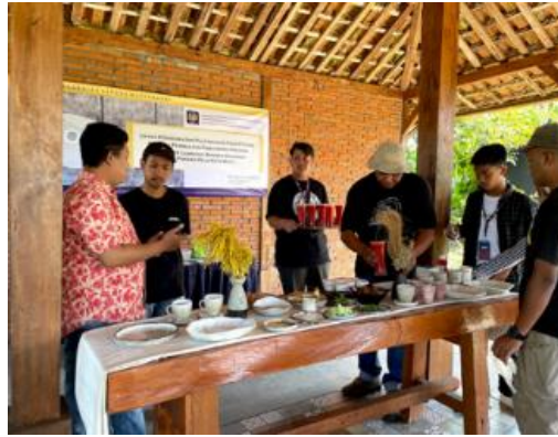
Gambar 5. Pelatihan foodstyling

Hasil kegiatan ini dapat ditunjukkan dalam table berikut :