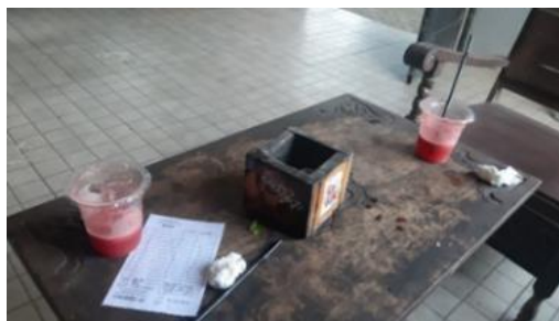
Gambar 2. Sajian minuman di kafe Lumbung