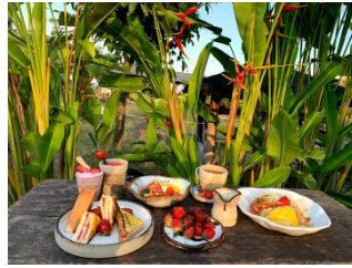
Gambar 6. Hasil Foodstyling

3). Paska Kegiatan, paska kegiatan berupa kegiatan penyerahan hasil berkarya keramik tableware untuk kebutuhan peningkatan tampilan sajian menu makanan dan minuman di Kafe Lumbung Bumdes Raharjo Desa Pandanrejo Kota Batu. Adapun yang diserahkan adalah sejumlah total 24 buah keramik, dengan rician : piring 3 model, masing-masing 4 buah, cangkir dan gelas 3 model masing-masing 4 buah, jadi total sejumlah 24 buah keramik. Proses penyerahan dilakukan di lokasi pelatihan yaitu di Joglo area wisata petik stroberi, dan secara langsung diterima oleh ketua tim manajemen wisata.