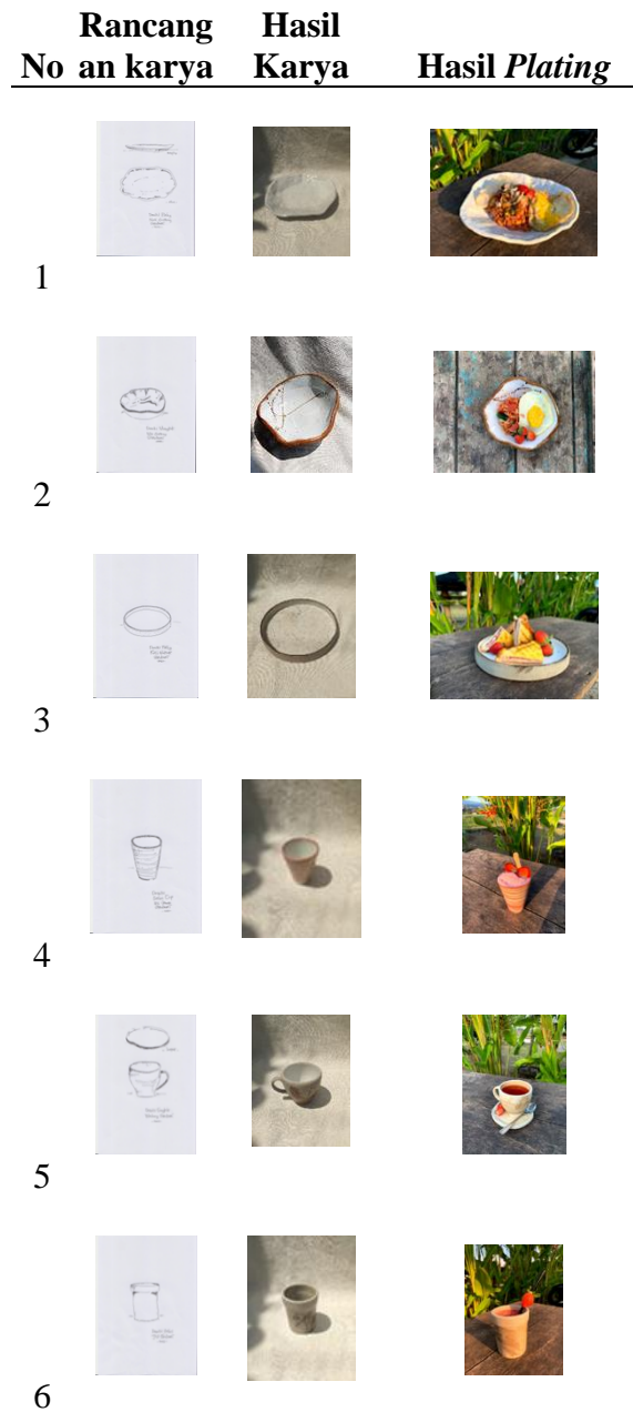
Table 1. Hasil Kegiatan

Hasil kegiatan ini dapat ditunjukkan dalam table berikut :