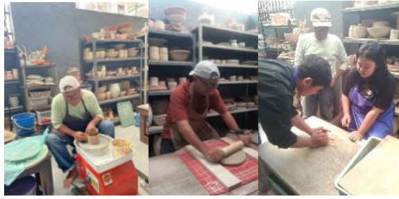
Gambar 3. Teknik berkarya tableware secara manual