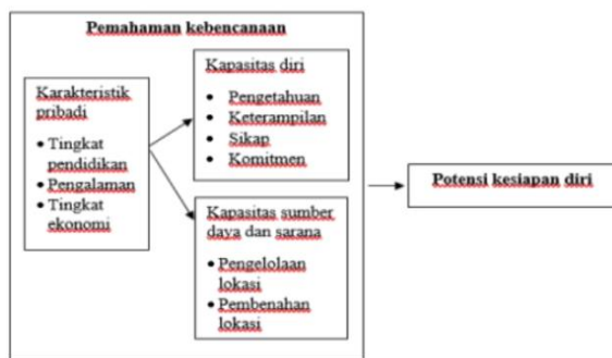
Gambar 2. Pemahaman Bencana dan Potensi Kesiapan Diri (Sumber: Hasil olah data peneliti)

Melihat definisi tersebut dan hasil data dari informan, dapat diketahui bahwa perubahan status kampung Jodipan menjadi kampung wisata memerlukan kesiapan yang menyeluruh. Evaluasi tujuan perubahan status, proses, serta keterlibatan individu dalam perubahan menentukan keberhasilan kelompok masyarakat yang tinggal di lokasi tersebut.