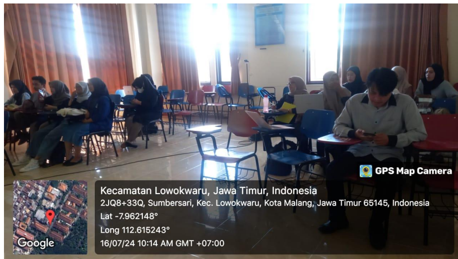
Gambar 3 kegiatan Pelatihan