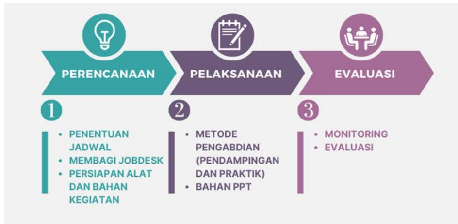
Gambar 1 Alur Kegiatan Pengabdian Kepada Masyarakat

Bahan yang digunakan dalam memberikan materi kepada mahasiswa ialah power point yang memuat langkah-langkah dalam menulis artikel serta sebagai media untuk mempermudah mahasiswa dalam memahami materi yang disampaikan melalui pemberian contoh secara langsung dari narasumber. Berikut adalah gambaran alur kegiatan Pengabdian Kepada Masyarakat (PKM).