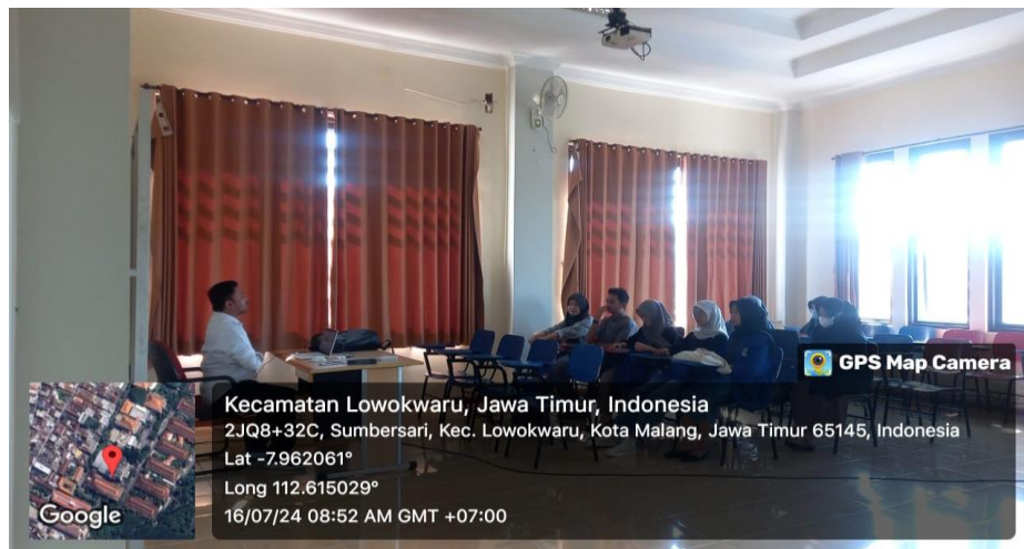
Gambar 2 kegiatan Pelatihan