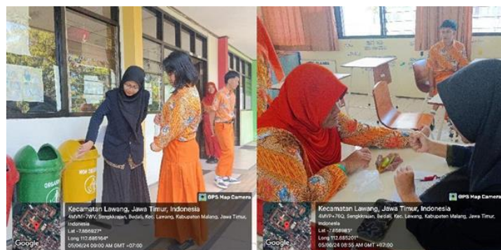
Gambar 1. Observasi dan pre test

Sebelum dilakukan budidaya maggot, peserta didik yang menjadi subjek kegiatan diobservasi terlebih dahulu dan diberikan asesmen pre test seperti yang ada pada gambar.