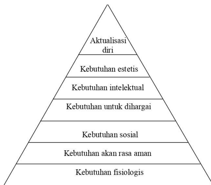
Gambar 1. Hierarki Kebutuhan Menurut Maslow (Jarvis, 2015)

Menurut Maslow (dalam Jarvis, 2015) mengembangkan teori motivasi manusia yang tujuannya menjelaskan segala jenis kebutuhan manusia dan mengurutkannya menurut tingkat prioritas manusia dalam pemenuhannya. Maslow membedakan D-needs atau deficiency needs yang muncul dari kebutuhan akan pangan, tidur, rasa aman, dan lain-lain, serta B-needs atau being needs seperti keinginan untuk memenuhi potensi diri. Hierarki kebutuhan menurut Maslow diejawantahkan dalam gambar sebagai berikut: