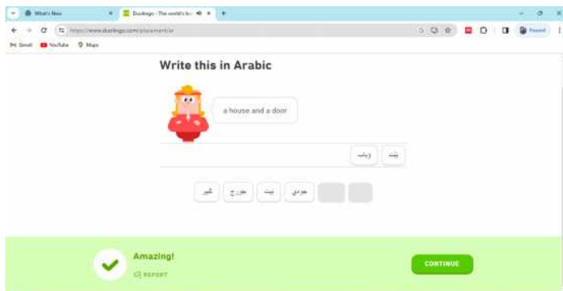
Gambar 2. Contoh Pembelajaran Bahasa Arab Menggunakan Game-Based Learning

dan diberikan perhatian khusus. Dengan pendekatan yang tepat, game-based learning dapat menjadi salah satu pilar penting dalam mencapai tujuan pendidikan Bahasa Arab yang diinginkan.