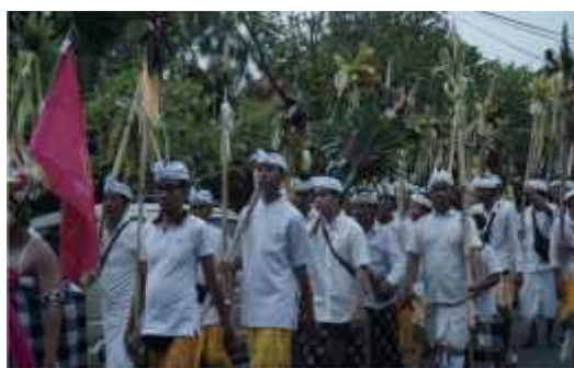
Gambar 1. Tradisi Ngerebeg Desa Blahkiuh

Dalam metode observasi, penulis melakukan pengamatan secara langsung ke Pura Luhur Giri Kusuma tempat berlangsungnya upacara tradisi Ngerebeg Desa Blahkiuh dan menyaksikan bagaimana prosesi tradisi Ngerebeg ini dilaksanakan.