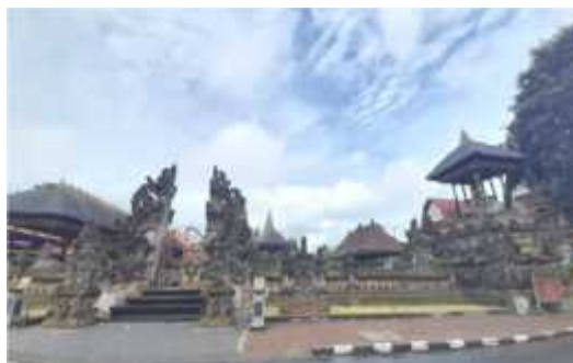
Gambar 2. Pura Luhur Giri Kusuma