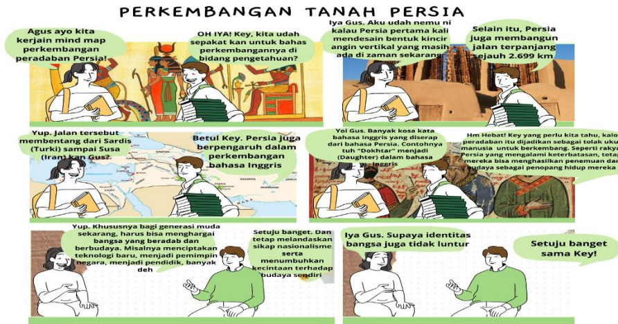
Gambar 1. Komik Perkembangan Tanah Persia

Hasil dan pembahasan pada rumusan yang kedua ialah Karakter berpikir kritis dan transformative dalam visualisasi komik peradaban Bangsa sebelum dan sesudah Islam.