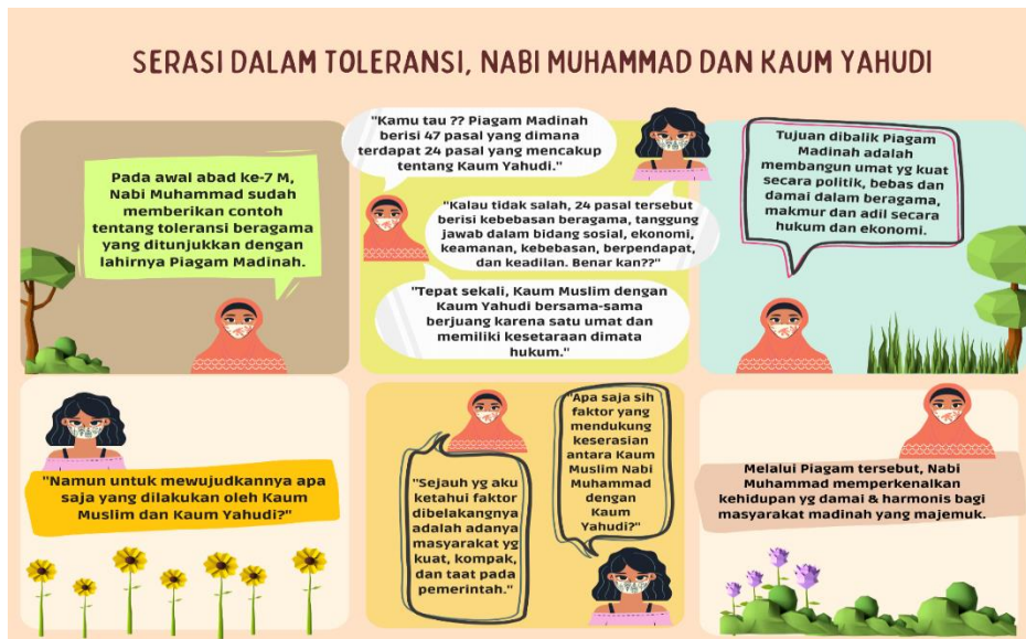
Gambar 3. Komik Perkembangan Tanah Persia

Sumber: Komik karya Inez Ardy (Mahasiswa Prodi Pendidikan Sejarah USD)