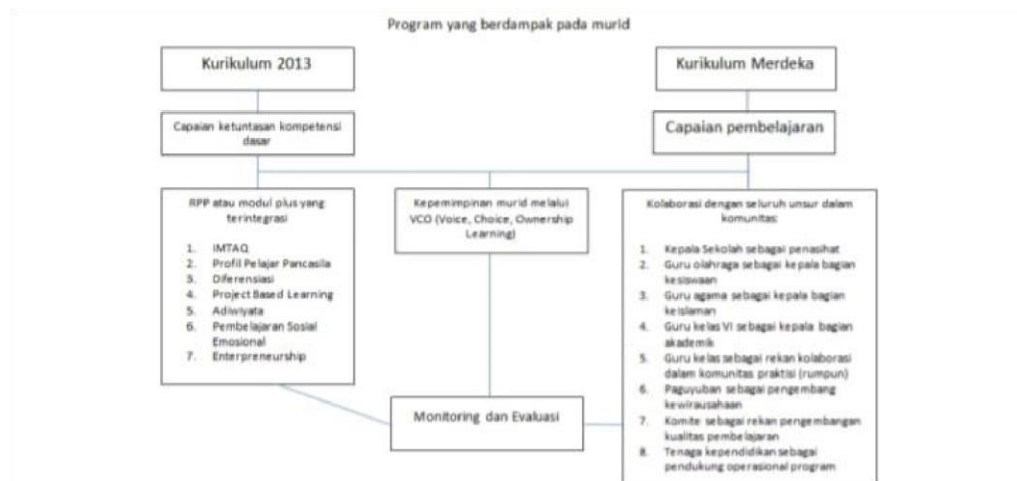
Gambar 1. Struktur Kurikulum Sekolah