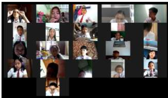
Gambar 2. Tahap Mengumpulkan Informasi

maka siswa dengan karakter kelas 3 dan 5 akan mengalami kesulitan dalam menyimak dan mendapatkan informasi cerita. Berikut adalah gambar pelaksanaan tahap mengumpulkan informasi. Selain itu, siswa dapat menerapkan kegiatan menyimak intensif sesuai dengan pendapat Solchan (2008) bahwa pada menyimak intensif dengan siswa memberikan pertanyaan-pertanyaan sebagai alat ukur untuk mengetahui daya simak siswa dengan cara lebih menekankan pada kemampuan untuk memahami bahan simakan.