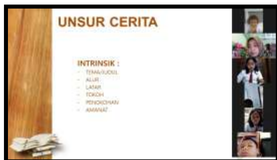
Gambar 1. Tahap Mengamati

Proses yang dilaksanakan siswa dan guru pada tahap mengamati ini sesuai dengan pendapat Tarigan (2008: 31) bahwa menyimak dilaksanakan sebagai suatu proses yang terdiri dari kegiatan mendengarkan lambang-lambang lisan dengan penuh perhatian, pemahaman, apresiasi, serta interpretasi untuk memperoleh informasi, menangkap isi atau pesan, serta memahami makna komunikasi yang telah disampaikan sang pembicara melalui ujaran atau bahasa lisan. Gambar di bawah ini adalah pelaksanaan tahap mengamati.