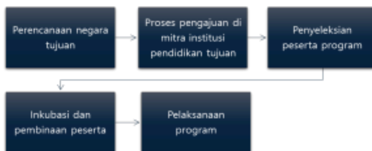
Gambar 3.1 Alur proses pelaksanaan program Global Learning (Dokumentasi penulis)

Transformasi peran humas di SMA Laboratorium UM mampu mengindikasikan dinamika yang signifikan pada upaya pengembangan citra sekolah melalui program kerjasama internasional, dalam konteks globalisasi di bidang pendidikan humas bukan lagi sekedar berperan sebagai komunikator pada lazimnya yang menjalin dan menjembatani komunikasi antara pihak sekolah dan masyarakat, akan tetapi telah berkembang menjadi pengelola dan katalisator strategi promosi yang merancang dan mengimplementasikan program pengembangan yang berkelanjutan. Program kolaborasi internasional yang digalakkan merupakan upaya untuk mengintegrasikan platform dalam penguatan hubungan citra positif antara sekolah dengan publik. Hasil temuan ini mampu menunjukkan bahwa peran program inovasi humas dengan menjalin kerjasama internasional dapat meningkatkan optimalisasi sekolah dalam upaya mem-branding identitas suatu lembaga pendidikan. Keberhasilan transformasi peran humas dalam proses pelaksanaannya mendapat dukungan dari beberapa faktor kunci diantaranya: kualifikasi sumber daya manusia yang memadai dan kompeten di bidangnya, komitmen staf humas yang tinggi dalam penyelesaian tugas serta tanggung jawab program,