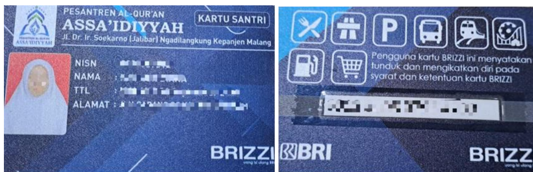
Gambar 4. Kartu E-Money Santri (Uang Saku)

Manajemen keuangan lembaga direformasi dengan menggunakan aplikasi Junio Smart yang terintegrasi dengan BRIVA, sedangkan untuk keuangan santri yaitu uang saku terintegrasi dengan BRIZZI. Pada penerapannya, setiap santri dibuatkan akun sendiri-sendiri dan memiliki rekening pribadi. Rekening tersebut divisualisasikan dalam bentuk kartu santri yang juga menjadi kartu E-Money untuk seluruh transaksi yang ada di lingkungan pesantren. Wali murid bisa mengirimkan uang saku anaknya melalui rekening pribadi anaknya serta dapat memantau mutasi keuangannya. Hal tersebut memudahkan orang tua dan pimpinan pesantren dalam melakukan pengawasan terhadap budaya konsumtif para santri. Dengan diberlakukannya sistem cashless melalui kartu E-Money di lingkungan pesantren, diharapkan pengelolaan keuangan menjadi lebih efisien, transparan, dan aman. Sistem ini dapat meminimalkan risiko kehilangan uang tunai serta meningkatkan akuntabilitas dalam setiap transaksi yang dilakukan oleh santri. Selain itu, penggunaan E-Money juga memberikan kemudahan bagi wali murid dalam memonitor pengeluaran anak mereka secara real-time melalui aplikasi pendukung. Dengan demikian, lingkungan pesantren dapat mengadopsi teknologi modern yang mendukung manajemen keuangan yang lebih baik, sekaligus memperkuat pendidikan karakter dalam hal tanggung jawab keuangan di kalangan santri. Berikut visualisasi kartu santri sekaligus E-Money yang telah berlaku di Pesantren Alqur'an Assa'idiyah.