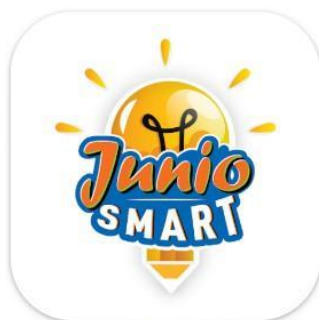
Gambar 1. Aplikasi Junio Smart

Berdasarkan latar belakang yang telah dipaparkan, Pesantren Al Qur'an Assa'idiyyah berinovasi dengan memanfaatkan sebuah aplikasi yakni Junio Smart. Aplikasi Junio Smart merupakan sebuah aplikasi yang dikembangkan oleh PT Bank Rakyat Indonesia (Persero) TBK dengan tujuan utama mendukung sistem pengelolaan sekolah agar lebih efisien, khususnya dalam menyampaikan informasi kepada orang tua siswa (Sihotang & Hudi, 2023). Aplikasi ini mencakup Sistem Pengelolaan Manajemen Sekolah yang mencakup berbagai aspek, seperti manajemen akademik, administrasi, dan informasi yang dirancang untuk memberikan kemudahan dan efisiensi dalam pengelolaan pendidikan melalui teknologi modern. Aplikasi ini dapat diakses oleh empat kelompok utama yaitu, administrator sekolah, guru, siswa, dan orangtua atau wali murid. Sekolah dapat menggunakan platform ini melalui web di alamat Junio-Smart.id, sementara siswa dan orangtua dapat mengunduh aplikasi mobile Junio Smart yang tersedia di App Store dan Play Store. Sistem ini dirancang untuk memudahkan komunikasi dan manajemen informasi pendidikan antara semua pihak terkait, memberikan akses yang mudah dan praktis sesuai peran masing-masing pengguna.