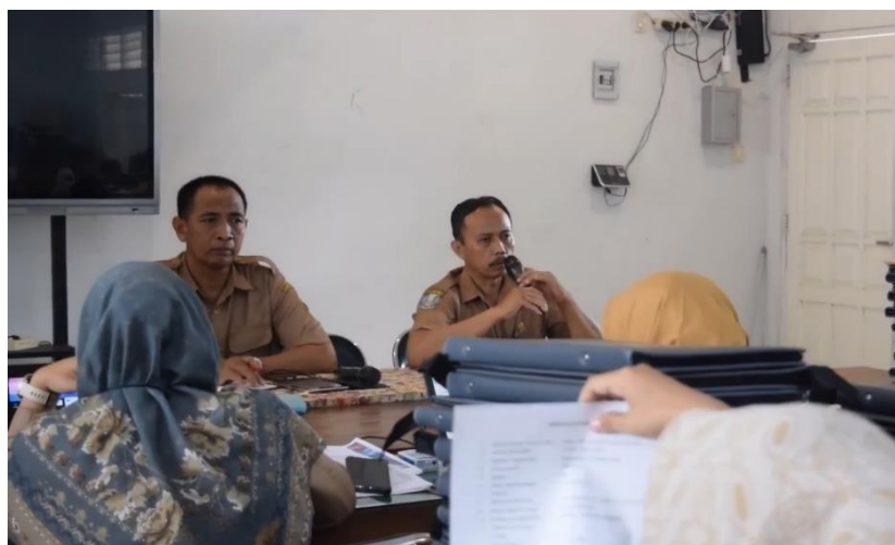
Gambar 1. Rapat penyusunan kurikulum dan program sekolah

Latar belakang dan tujuan dalam perencanaan program zikir bersama lover didasari oleh kebutuhan mengembangkan karakter dan spiritualitas siswa dalam lingkungan pendidikan. Tantangan moral dan spiritual yang dihadapi generasi muda semakin kompleks, baik di lingkungan sosial maupun melalui pengaruh teknologi, sehingga memerlukan pendekatan yang terarah dalam membentuk sikap dan nilai-nilai positif. Program zikir bersama lover dirancang sebagai langkah konkret untuk memperkuat pendidikan karakter siswa dengan pendekatan spiritual, yang dilaksanakan secara rutin setiap pagi sebagai bagian dari aktivitas sekolah. Program zikir bersama lover bertujuan untuk membentengi siswa dari pengaruh buruk yang ada dan tentunya dengan adanya program ini, siswa mampu mengembangkan sikap disiplin, kesabaran, dan tanggung jawab,