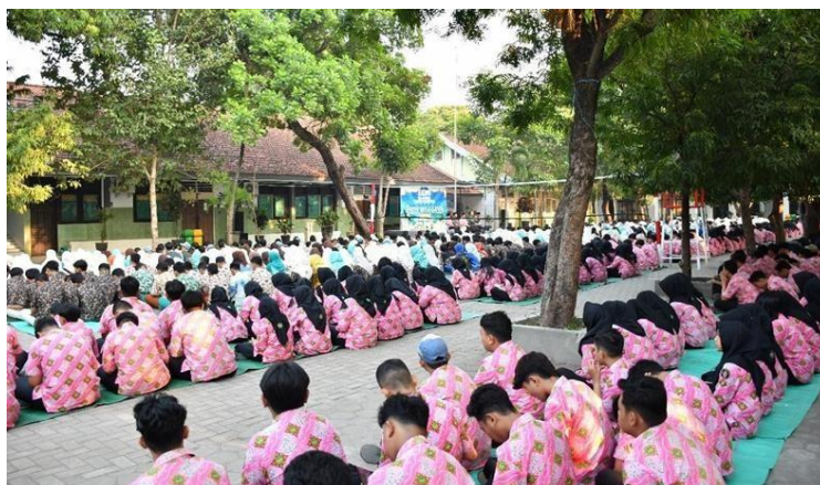
Gambar 3 Pelaksanaan program zikir bersama lover berlokasi di lapangan upacara sekolah

Pihak sekolah berupaya menyediakan fasilitas yang sesuai dan memadai, seperti tempat untuk kegiatan zikir bersama, buku zikir dan peralatan pendukung untuk mendukung pelaksanaan program secara efektif (Ali, 2021). Keberadaan sarana yang memadai memungkinkan pelaksanaan program berjalan lebih lancar, terarah, dan sesuai dengan tujuan pendidikan yang telah direncanakan, yakni membentuk karakter siswa yang kuat dan berakhlak mulia. Program yang didukung dengan sarana yang baik akan memberikan pengalaman belajar yang berkualitas, sehingga siswa merasa lebih terinspirasi dan terdorong untuk terus konsisten untuk mengikuti program zikir (Ali, 2021). Kepala sekolah, guru, serta staf sekolah memainkan peran kunci dalam manajemen organisasi pendidikan. Mereka bertanggung jawab untuk mengatur anggota tim, memfasilitasi pembagian tugas, serta mengelola wewenang dan tanggung jawab di antara anggota organisasi. Hal ini bertujuan untuk memastikan bahwa semua pihak dapat bekerja sama dengan efektif untuk mencapai tujuan yang telah ditetapkan (Hasibuan, 2011).