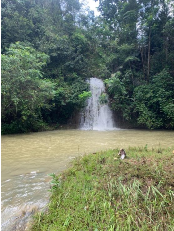
Gambar 1. Coban Asmoro

biasanya di sebut dengan sebutan jurug jero yang berarti sebuah kolam yang sangat dalam. Berikut adalah foto observasi penulis dan tim ke Coban Kembar Gajahrejo.