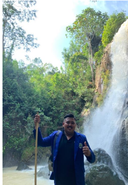
Gambar 2. Coban Kembar