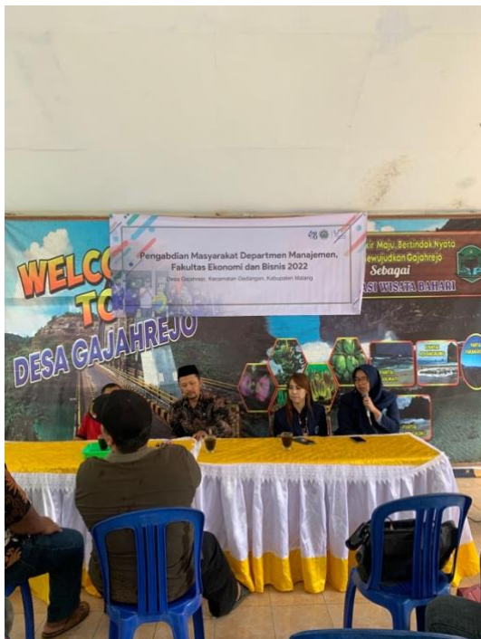
Gambar 3. Dialog dengan Warga

Wisata Coban Kembar dengan segudang potensi wisata alam, akan tetapi belum ada perencanaan yang terstruktur terkait perkembangan wisata Coban ini sehingga untuk melaksanakan pengembangan wisata ini belum dapat dikoordinir dan dimulai dengan baik. Fasilitas prasarana dan sarana yang dsangat minim tidak dapat dipungkiri akan mengakibatkan penghambatan perkembangan wisata coban tersebut, oleh karena itu dilakukan perencanaan menyeluruh sebagai upaya pengembangan wisata coban tersebut, khususnya prasarana dan sarana umum yang harus segera direalisasikan seperti akses jalan, toilet umum, gazebo, parker kendaraan, dan papan informasi. Hal ini bertujuan supaya Coban Kembar mampu bersaing dengan wisata alam lokal sekitar lainnya terkhusus yang berlokasi di Malang.