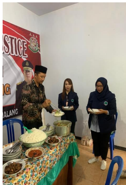
Gambar 4. Makan Bersama Kades