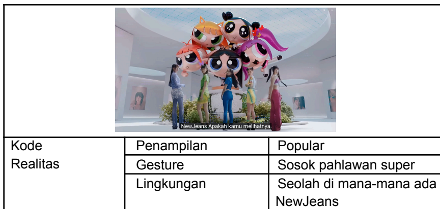
Tabel 3.8 Kode Realitas Tekad dan Harapan NewJeans

Kode realitas menunjukkan bahwa NewJeans menjadi sosok yang populer sehingga tampil di berbagai platform seperti media massa, koran, billboard, mural dan google captcha, bahkan NewJeans digambarkan seperti “The New little Women” juga diabadikan dalam bentuk monumen 3 dimensi. Kode gestur