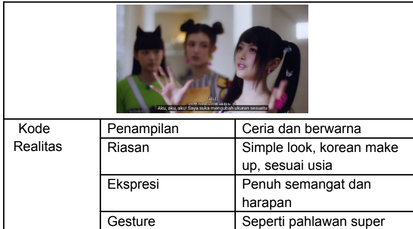
Tabel 3.2 Kode Realitas Tekad dan Harapan NewJeans

Scene ini mencerminkan kode realitas dengan cara pakaian yang mereka pakai berwarna cerah dan tampilan make-up yang sederhana (simple look) korean make-up yang disesuaikan dengan usia anggota NewJeans. Penampilan mereka memberikan kesan yang ceria dan berwarna. Ekspresi dan gerakan anggota NewJeans saat mereka berbicara tentang keinginan untuk memiliki kekuatan super mata mereka penuh dengan semangat dan harapan. Dan memberikan kode gestur seperti sosok pahlawan super dengan memeragakan tangan yang memegang tongkat seperti seorang pahlawan. Hal ini menunjukkan keinginan mereka menjadi pahlawan super.