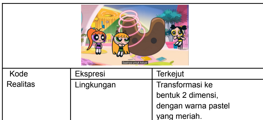
Tabel 3.5 Kode Realitas Kekompakan dan Optimisme NewJeans