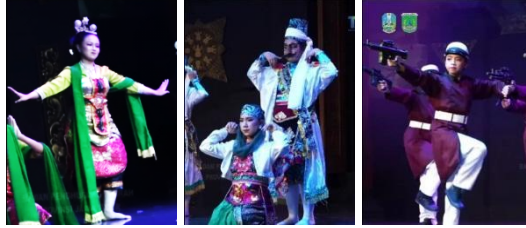
Gambar 1 Tata Busana Pada Pertunjukan Laro Bocah

Pada pola lantai pertunjukan Laro Bocah menggunakan pola lantai yang sangat sederhana yaitu pola lantai lengkung, horizontal maupun vertikal. Hanya saja pada Tari Lingsir terdapat pola lantai yang harus dipertahankan yaitu pola lantai dimana penari perempuan menghampiri penari laki-laki sehingga menjadi berpasangan. Pada Tari Lingsir pola lantai berpasangan antara laki-laki dan perempuan yang memiliki penggambaran bagaimana proses terciptanya manusia mulai dari terciptanya Adam lalu diikuti dengan Hawa. Selain itu pola lantai yang masih dipertahankan pada pertunjukan ini terdapat pada Tari Polisi Seri yang menggunakan pola lantai berpindah-pindah karena menggambarkan masyarakat setempat yang sedang melawan penjajah dengan taktik perang gerilya. Dengan demikian dengan adanya pola lantai tersebut tidak hanya difungsikan sebagai unsur pendukung tari yang berhubungan dengan nilai estetis saja, melainkan sebagai sarana penyampaian makna yang digambarkan melalui perpindahan tempat penari.