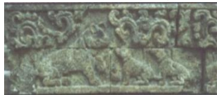
Gambar 4. Relief Singa dan Serigala Pada Candi Jago, Malang

Lalu pada Candi Jago ditemukan relief singa. Pada Candi Jago ditemukan dua relief yang diduga berbentuk hewan singa. Relief pertama yang menggambarkan singa dipahatkan pada bagian depan candi menghadap ke arah barat. Relief ini menggambarkan seekor singa yang sedang berhadapan dengan dua ekor hewan yang terlihat mirip dengan serigala.