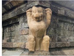
Gambar 3. Arca Singa Pada Candi Kidal, Malang

Penggunaan patung hewan singa sebagai simbol telah ada dalam sejarah Kota Malang selama ratusan tahun sejak masa Hindu Buddha, masa kolonial hingga saat ini. Bukti penggunaan singa sebagai simbol pada masa Hindu-Buddha dapat dilihat pada arca singa di Candi Kidal. Kerajaan Singasari di Malang meninggalkan salah satu peninggalan bersejarah yaitu Candi Kidal. Pada 4 sisi Candi Kidal, terdapat 4 arca singa. Ada empat patung singa di lereng candi Kidal. Di kedua sisi tangga dan di setiap sudut candi yang ditinggikan terdapat patung singa yang memegang kedua tangan dan menghadap ke depan.