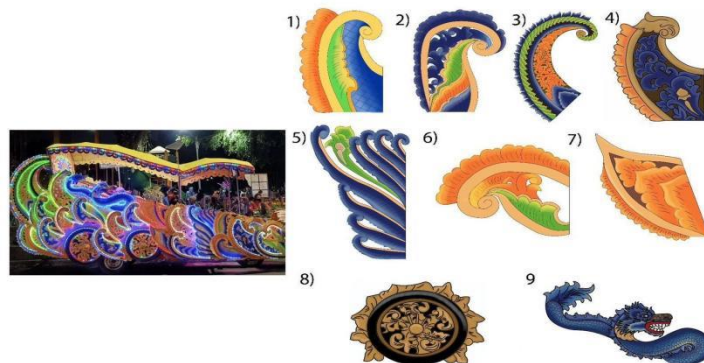
Gambar 1. Tampak Samping Odong-Odong

Visualisasi ornamen pada angkutan odong-odong yang menghadap samping tersebut terdiri dari: 1-8) Ornamen geometri, arti dari ornamen geometri yaitu motif ornamen yang bersumber dari elemen motif geometris. Pada peradaban prasejarah ornamen jenis ini banyak sekali dijumpai mulai dari garis lengkung, lurus, segitiga, lingkaran, segi empat, dan masih banyak lagi [7]. Ornamen geometris menghiasi keseluruhan bagian samping odong-odong. Selain untuk memberikan efek yang lebih khas, ornamen geometris ini juga memberikan kesan tampilan odong-odong yang lebih ciamik. 9) Ornamen fauna, pada ornamen tersebut menggambarkan hewan naga.