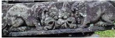
Gambar 5. Relief Dua Singa Pada Candi Jago, Malang