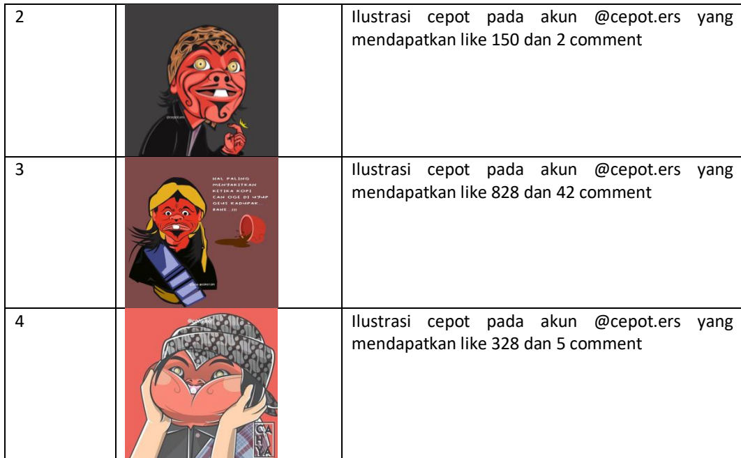
Tabel 1: Ragam ilustrasi cepot yang terdapat pada akun @cepot.ers di social media instagram.