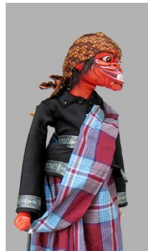
Gambar 1: Karakter Cepot pada wayang golek sunda

Selain dari sejumlah aspek teknis pedalangan seperti yang telah disampaikan pada paragraph sebelumnya, dalang juga diharuskan untuk memahami setiap karakter wayang golek yang menjadi bagian dari pertunjukan. Secara umum, karakter wayang golek akan dibagi menjadi beberapa kelompok yaitu satria, ponggawa, buta, dan punakawan. Setiap karakter akan memiliki raut wadanya tersendiri yang menggambarkan identitas, karakter maupun watak dari masing-masing karakter tersebut (Suryana, 2002). Sebagai salah satu tokoh punakawan, Cepot yang merupakan salah seorang putra dari Semar, menjadi karakter yang sangat divoritkan oleh para penonton. Bahkan oleh dalang, Cepot terkadang dijadikan sebagai sarana untuk berdialog secara langsung dengan para penonton, maupun dengan para pejabat pemerintahan yang hadir menyaksikan pertunjukan wayang golek secara langsung. Mengingat kepopulerannya yang sangat tinggi, Cepot dihadirkan juga pada beragam media di luar panggung pertunjukan wayang golek sebagai sarana ekspresi dalam menyampaikan suatu pesan.