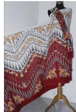
Figure 5. Motif Keris Ki Ronggo