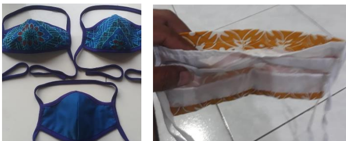
Figure 6. Gambar masker batik yang diproduksi Bapak Mahrus Ali, masker yang diproduksi mengikuti standar pembuatan masker

Penggunaan masker sendiri menurut WHO, menjadi salah satu yang dapat dilakukan secara massif untuk menekan laju penyebaran virus COVID-19 . Masker kain yang baik setidaknya memenuhi persyaratan sebagai berikut: 1)Terbuat dari kain yang memiliki serat kain padat, 2)Minimal 2 lapis dan ada kantung filter didalamnya, 3)Sesuaikan ukuran masker dengan wajah, dan 4)Proses pembuatan masker dilakukan dengan tangan yang bersih dan alat yang bersih juga (Dewi, 2020). Mahrus Ali menjamin masker batik buatannya sudah memenuhi kriteria tersebut. Ia membuat masker tipe 2 dan 3 lapis, baik yang model karet atau earloop.