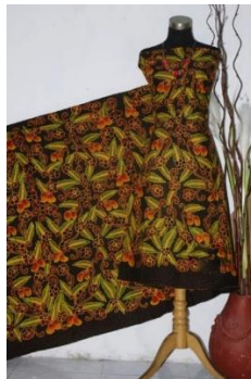
Figure 3. Motif Mangga Arum Mukti