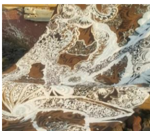
Figure 2. Motif Pari Sari Mukti