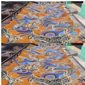
Figure 1. Motif Cahyaning Suryo Mukti

Kembali pada batik tulis Ronggo Mukti, di sentra ini memiliki beberapa motif batik yang menjadi ciri khasnya, antara lain motif cahyaning suryo mukti, motif pari sari mukti, motif mangga arum mukti, motif angin gending, motif keris ki ronggo, dan masih banyak motif yang lain. Wujud motif-motif tersebut dapat dilihat dari gambar berikut: