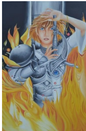
Gambar 6. Spirit of Jeanne d'arc , Karya Ni Nyoman Sutrisni, Sumber: Dok. Hardiman

Ni Nyoman Sutrisni memvisualkan cerita ini dengan penggambaran perempuan muda berparas cantik. Separo badannya mengenakan pakaian perang, separo yang lain mengenakan busana sehari-hari. Perempuan ini selain memegang senjata perang juga mengenakan gelang salib di tangannya. Dua properti ini dapat dibaca sebagai kesatria yang suci. Di latar depan tampak api membakar tubuhnya yang terikat pada sebuah tiang. Potongan fragmen cerita Spirit of Jeanne d'arc ini dapat mewakili keseluruhan narasi cerita kepahlawanan Perancis (lihat gambar 6).