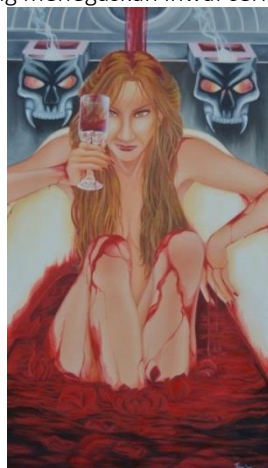
Gambar 5. Elizabeth Bathory: Bloody Bathtub , Karya Ni Nyoman Sutrisni

Ni Nyoman Sutrisni memvisualkan cerita fiksi Elizabeth Bathory dengan menghadirkan tokoh utama cerita ini yang menguasai lebih dari setengah bidang gambar. Hal ini menunjukkan bahwa tokoh utama itu penting dan menjadi pusat perhatian. Di samping itu, Elizabeth yang duduk berendam di bathtub itu menghadap secara frontal ke arah pemirsa. Karakter Elizabeth yang jahat dapat dilihat dari pelukisan tubuhnya yang cenderung kurus yang lebih berkonotasi kepada kekejaman dan jauh dari kesan sensualitas. Wajah Elizabeth dilukiskan sebagai perempuan yang jahat dilihat dari sorot kedua matanya yang tajam pada satu fokus. Hal ini ditegaskan pula dengan penggambaran rambut yang terurai panjang hampir tak beraturan yang dibiarkan jatuh di bagian samping kiri kanan wajahnya. Sebagai penguat penokohan, juga sejalan dengan cerita bahwa Elizabeth suka meminum darah gadis muda, Ni Nyoman Sutrisni melukiskan Elizabeth sedang memegang gelas minum. Menariknya di dalam gelas ini terdapat cairan berwarna merah yang segera terhubung dengan darah segar. Dengan demikian, pelukisan ini secara berterus terang menegaskan ihwal cerita Elizabeth.