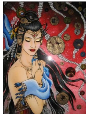
Gambar 4. Putri Impiani Karya Ni Nyoman Sutrisni