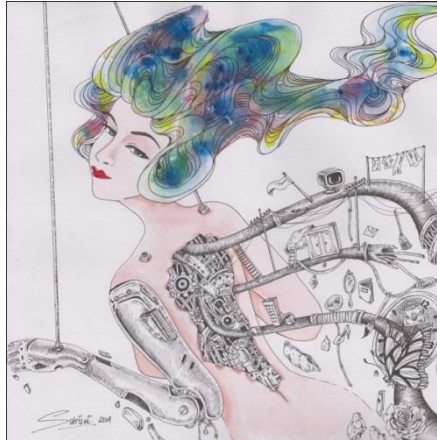
Gambar 7. Wowan Life Karya Ni Nyoman Sutrisni

tangan dan tubuh yang terikat tali penggerak sebagai penanda bahwa ada orang lain yang mengendalikan perempuan itu. Dalam hal ini orang lain yang dimaksud sesuai dengan konteks budaya Ni Nyoman Sutrisni sebagai perempuan Bali dapat dibaca sebagai orang tua, suami, mertua, atau kuasa patriarki pada umumnya.