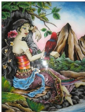
Gambar 3. Putri Impiani I Karya Ni Nyoman Sutrisni

Karya lainnya dari Ni Nyoman Sutrisni juga mengkritisi citra cantik merupakan dua lukisan kaca ( glass painting ), Putri Impian . Kedua lukisan ini secara terbuka memperlihatkan idealitas perempuan cantik melalui penggambaran tubuh perempuan dalam proporsi yang ideal, berkulit bersih, berparas cantik, dan gemulai. Penggambaran ini merupakan penggambaran ilusif yang secara implisit terlihat dari busana dan mahkota yang dikenakan perempuan-perempuan ini. Busana dan mahkota yang dikenakan dua putri impian ini merupakan busana dunia dongeng atau fiksi (lihat gambar 3 dan 4).