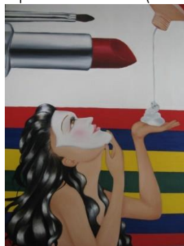
Gambar 2. Palsu Karya Sutrisni

“... kosmetik merupakan alat penghapus wajah. Kepalsuan kosmetik tidaklah memisahkan subjek, namun secara misterius mengubahnya. Menurut Buadrillard, perempuan sadar akan transformasi ini ketika, di depan cermin, mereka harus menghapus diri mereka sendiri untuk memakai make-up , dan ketika, dengan memoleskan make-up , mereka masuk ke dalam penampakan murni yang hampa akan makna”. (Adlin dan Kurniasih, 2006: 236)