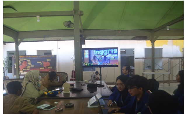
Gambar 5. Konsultasi Dengan Pihak Desa

masukan dan penilaian dari pihak desa sangat penting. Dengan demikian, video yang dihasilkan dapat benar-benar mewakili karakter dan keunikan Desa Tulungrejo, sekaligus memenuhi harapan dan tujuan promosi yang diinginkan.