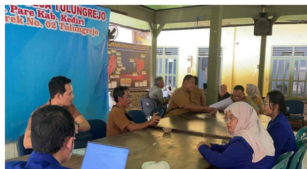
Gambar 1. Rapat kerja

Pada tahap ini, tim produksi menentukan tujuan utama dari pembuatan video promosi. Dimana video ini bertujuan untuk memberikan informasi mengenai Kampung Inggris dan pasar senja (Prajana & Razi 2024). Target audience dari video promosi ini kepada warga lokal maupun pendatang yang dimana informasinya dapat dengan mudah diakses.