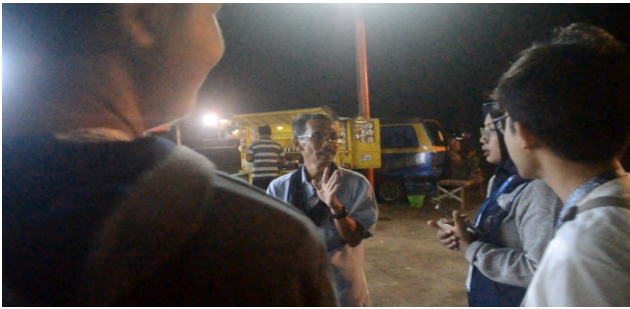
Gambar 3. Proses Perekaman Video