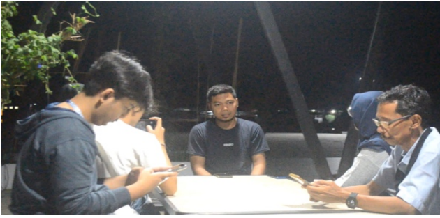
Gambar 2. Proses Wawancara