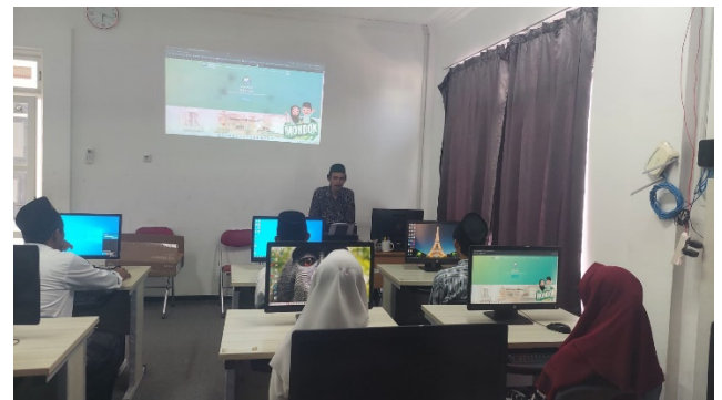
Gambar 2. Kegiatan Life Skill Training di Pondok Pesantren Al Fitroh.