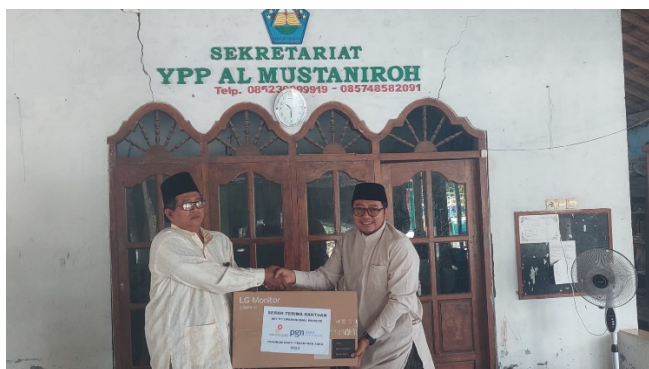
Gambar 4. Serah Terima Satu Set Komputer kepada Pondok Pesantren Al Mustaniroh.

Memberikan dukungan satu set komputer untuk mendukung operasional website merupakan salah satu langkah dalam meningkatkan kemampuan pesantren untuk mengelola website mereka dengan efisien. Dengan komputer yang tersedia di pesantren, staf atau santri yang bertanggung jawab atas pengelolaan website akan memiliki akses yang lebih mudah dan cepat untuk melakukan pembaruan konten, memantau statistik, dan menjalankan operasi teknis lainnya. Komputer yang memadai juga memungkinkan staf untuk mengembangkan konten website yang lebih kreatif dan menarik, seperti video, foto, dan materi pendidikan interaktif lainnya.