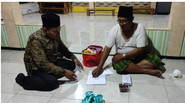
Gambar 1. Proses Penggalian Informasi Kepada Pengasuh Pondok Pesantren Al Mustaniroh.

Pada tahap ini dilakukan penggalian informasi pada masing-masing pondok pesantren terkait potensi sumber daya yang dimiliki serta kebutuhan dari pondok pesantren dalam kaitannya dengan pengembangan website. Kegiatan ini dimaksudkan untuk mengidentifikasi sumber daya lokal yang dimiliki oleh pondok pesantren yang mencakup: (1) tangible asset yang mencakup sarana dan prasarana seperti ketersediaan komputer dan jaringan wifi, dan lain-lain, (2) sumber daya manusia (santri, pengurus, pengasuh, ulama), dan (3) sumber daya lain yang dimiliki oleh pesantren dalam bentuk intangible asset seperti kurikulum diniyah, program ekstrakurikuler pesantren, sistem penerimaan santri baru, dan sumber daya lain yang terkait. Pemetaan ini bertujuan memetakan aset fisik dan non fisik pesantren yang dapat diberdayakan untuk kebutuhan pengembangan dan operasional website. Pada kegiatan ini dilakukan proses perancangan program atau kegiatan berdasarkan pada potensi yang telah diidentifikasi, adapun program yang dirancang dalam kegiatan ini adalah program pelatihan pengelolaan website untuk pondok pesantren. Pemetaan ini dilaksanakan selama kurun waktu 18 Juni hingga 31 Juli 2023.