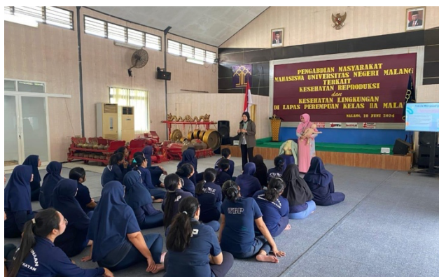
Gambar 2. Pelatihan Sesi Pertama

Sesi pertama dilaksanakan pada tanggal 10 Juni 2024. Pada sesi ini, narapidana diperkenalkan dengan konsep dasar kesehatan reproduksi, yang mencakup pemahaman tentang kondisi kesehatan reproduksi di dalam lapas. Selain itu, pada sesi ini juga dijelaskan berbagai tantangan yang dihadapi narapidana perempuan terkait kesehatan reproduksi, hak-hak mereka dalam memperoleh layanan kesehatan, serta permasalahan kesehatan yang sering terjadi di lapas. Pendekatan ini membantu meningkatkan kesadaran narapidana perempuan mengenai pentingnya menjaga kesehatan reproduksi meski berada dalam kondisi terbatas. Berikut merupakan dokumentasi pelatihan sesi pertama yang telah dilaksanakan.