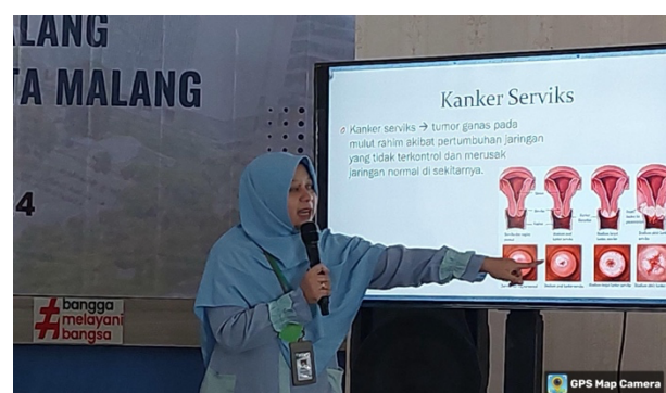
Gambar 3. Pelatihan Sesi Dua

Berikut merupakan dokumentasi pelatihan sesi kedua yang telah dilaksanakan. Materi selanjutnya yaitu pencegahan dan penanganan IMS (infeksi menular seksual), khususnya HIV/AIDS. Materi dalam sesi ini meliputi edukasi tentang cara penularan IMS, layanan pengujian HIV yang tersedia di lapas, serta pentingnya akses terhadap perawatan yang tepat bagi yang terinfeksi. Selain itu, narapidana perempuan juga diajak untuk berdiskusi mengenai penggunaan kondom sebagai salah satu metode pencegahan, program pertukaran jarum suntik bagi pengguna narkoba, serta konseling dan dukungan untuk pencegahan dan pengelolaan IMS HIV/AIDS yang bertujuan untuk meminimalisir risiko penularan IMS di lingkungan lapas.